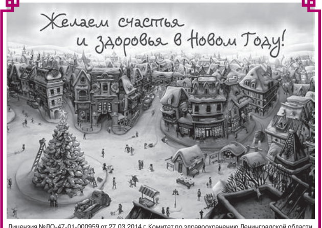
Лицензия №ЛО-47-01-000959 от 27.03.2014 г. Комитет по здравоохранению Ленинградской области

Какой новогодний стол без рыбных блюд?! Для сертоловчан ежедневно работает РЫБНЫЙ БАЗАР возле сертоловской бани. Большой ассортимент охлажденной рыбы. По отзывам благодарных покупателей, здесь лучшее сочетание цены и качества. УСТУПКИ! АКЦИЯ! С 25 декабря сертоловчанам предлагаются: - ФОРЕЛЬ за 499 рублей; - КАРП и САЖАН по 249 рублей!