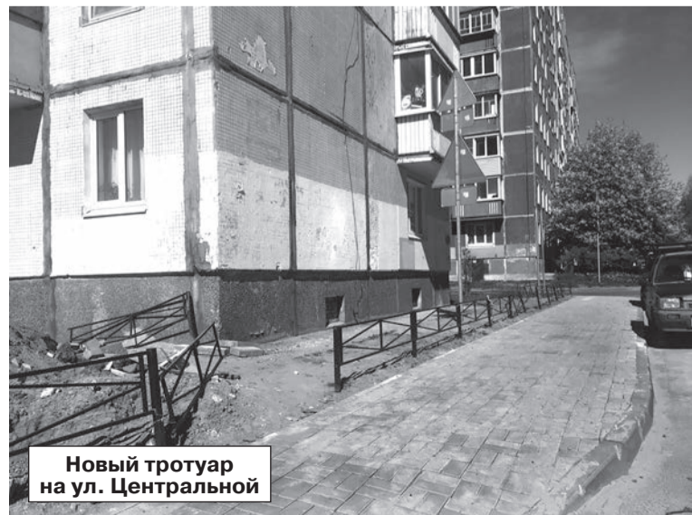
Новый тротуар на ул. Центральной