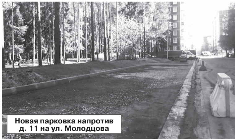
Новая парковка напротив д. 11 на ул. Молодцова

— 25 мая подписан контракт на обустройство территорий между домами №6 и 7 на