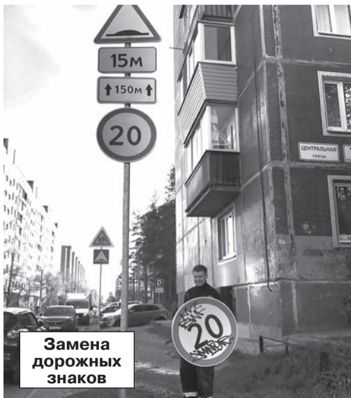
Замена дорожных знаков