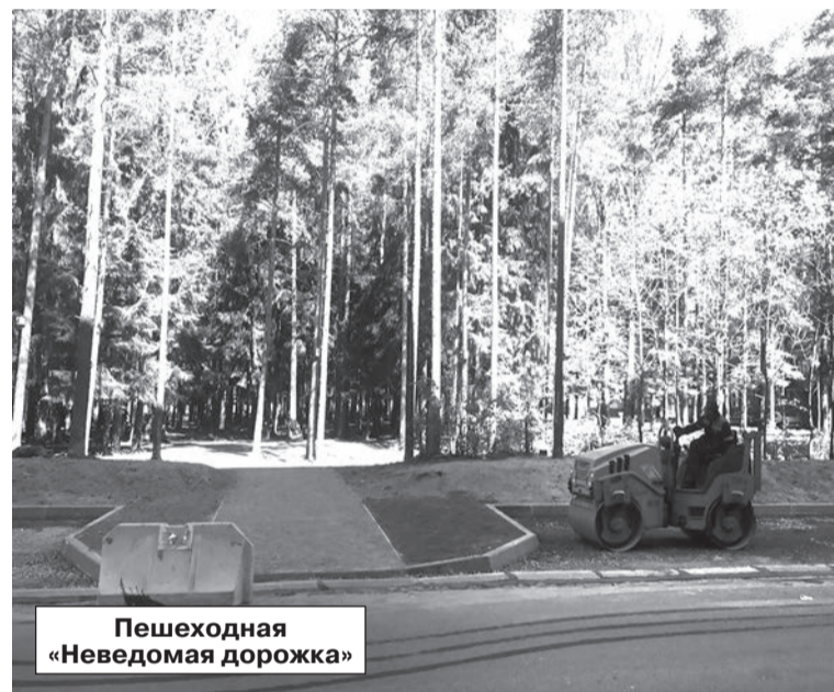
Пешеходная «Неведомая дорожка»

— Муниципальное учреждение «Оказание услуг» Развитие» заключило контракт на дезинфекцию детских и спортивных площадок. Согласно ему санобработка должна проходить дважды в месяц. В мае