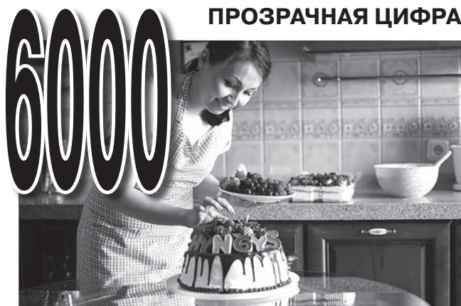
жителей Всеволожского района зарегистрировались в качестве самозанятых

бо после уведомления им налогового органа о прекращении такой деятельности.