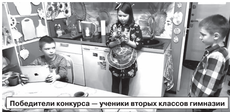
Победители конкурса – ученики вторых классов гимназии