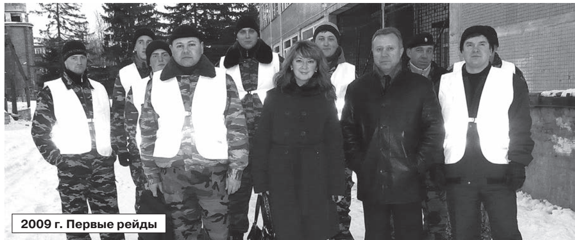
2009 г. Первые рейды