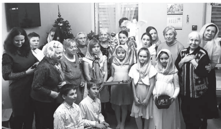
НА СНИМКЕ: «сергиевцы» в пансионате.

Растроганные жители рады нашим визитам. Работники пансионатов удивлены повышенной активностью и положительной динамикой тяжелобольных во время посещения представителей Архиерейского подворья. Радость Рождества Христова коснулась сердца каждого присутствующего.