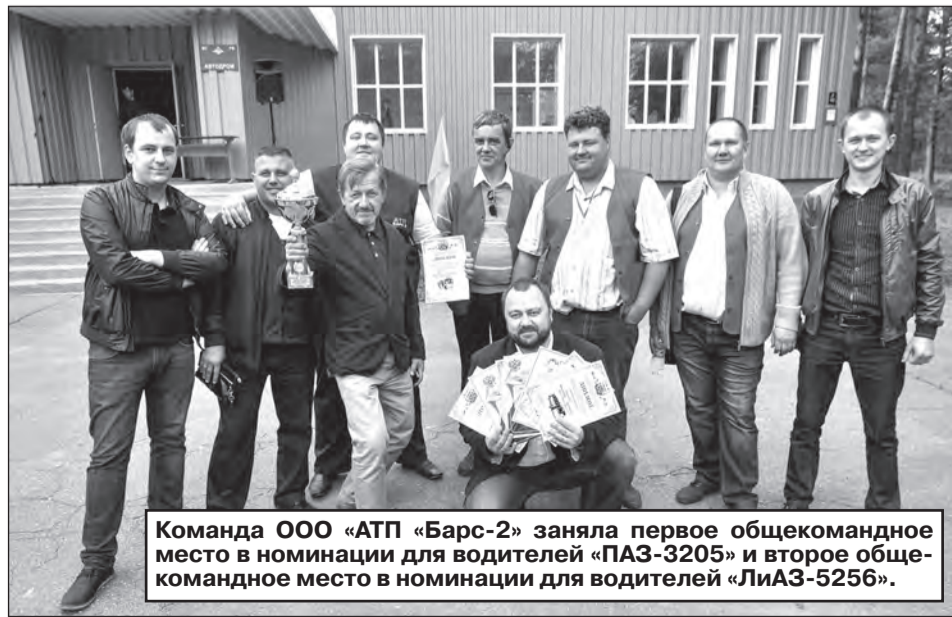
Команда ООО «АТП «Барс-2» заняла первое общекомандное место в номинации для водителей «ПАЗ-3205» и второе общекомандное место в номинации для водителей «ЛиАЗ-5256».