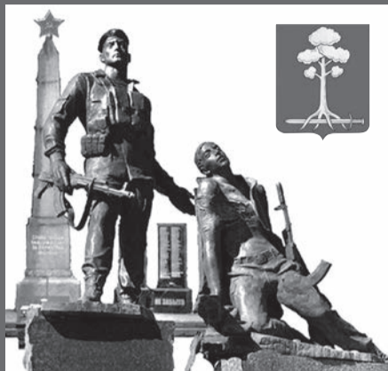
МУНИЦИПАЛЬНОЕ ОБРАЗОВАНИЕ СЕРДОЛОВО