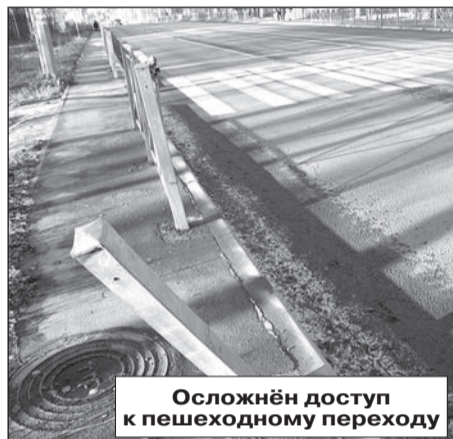
Осложнён доступ к пешеходному переходу