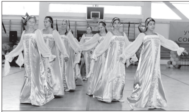
«Школьные годы» дарят танец ветеранам и гостям.