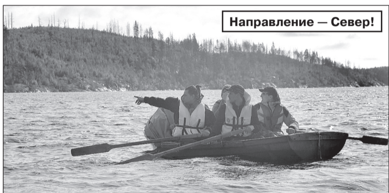
Направление - Север!

Лумиваара (перевод с финского «заснеженная гора») уже с неделей. Разместились (вернее, укрылись от дождя) мы на гостеприимной турбазе «Лена-Ладога».