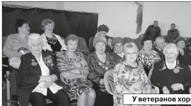
У ветеранов хорошее настроение.