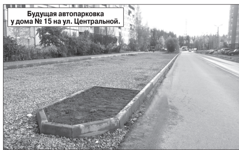
Будущая автопарковка у дома № 15 на ул. Центральной.