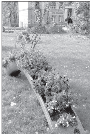
Последние цветущие растения на ул. Ларина.

Подготовила Галина ВИНОГРАДОВА