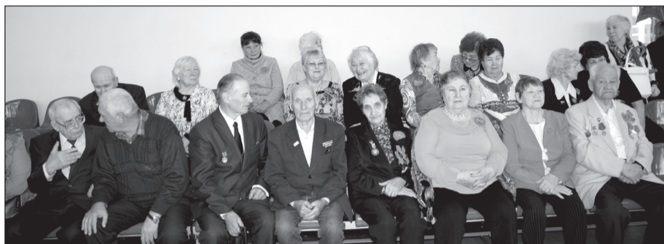
Сертоловские ветераны на празднике.

Актив ветеранской организации - самый верный помощник администрации города, активный участник общественно-политической, культурной и спортивной жизни Сертолово. Ни одно городское мероприятие не обходится без участия ветеранов. Особой заботой Совета окружены ветераны Великой Отечественной войны, которых в нашем городе с каждым годом остаётся всё меньше и меньше. И самой важной работой, которую ведёт Совет, по праву считают патриотическое воспитание подрастающего поколения. Именно об этом говорили многие выступа-