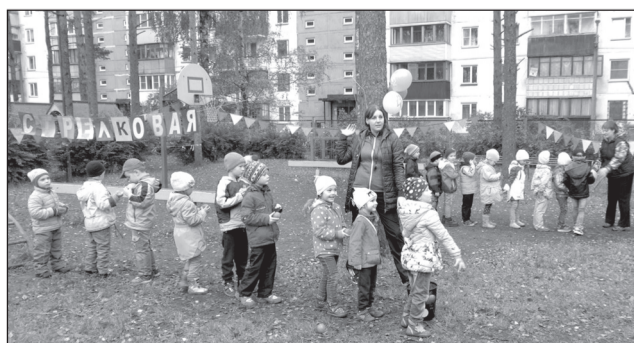
День здоровья в дошкольном учреждении.

По данным руководства дошкольного отделения