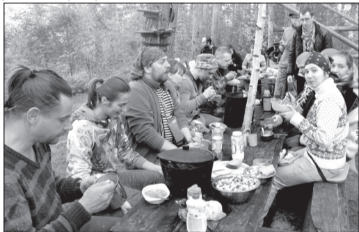
Обед на привале.

И тут погода словно испытывала нас. Весь день лил дождь, который не прекращался и в посёлке