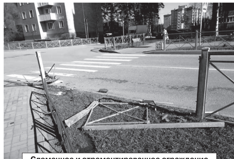
Сломанное и отремонтированное ограждение у д. № 6/2 на ул. Центральной