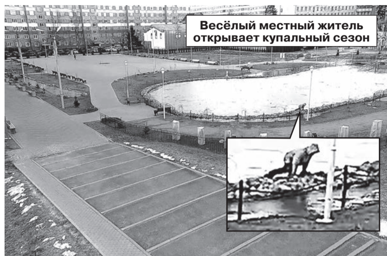
Весёлый местный житель открывает купальный сезон