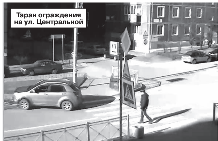
Таран ограждения на ул. Центральной