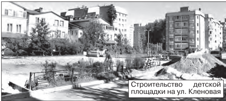
Строительство детской площадки на ул. Кленовая