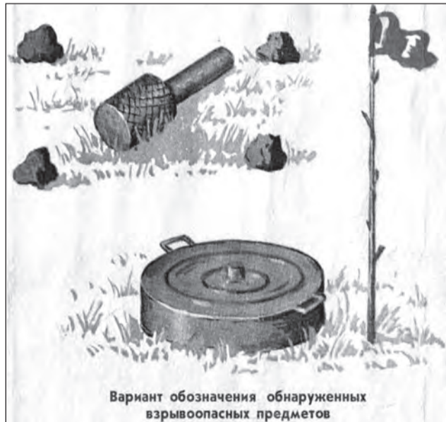
Вариант обозначения обнаруженных взрывоопасных предметов

7. Наличие наклеек с надписями на поверхности крышек коробок (например, «Бомба», «Тротил», «Взрыв», «Заминировано» и т. п.).