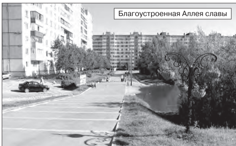
Благоустроенная Аллея славы

- Большой интерес сертоловчан вызывает территория у дома номер 6 по улице