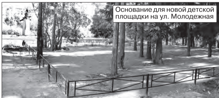
Основание для новой детской площадки на ул. Молодежная