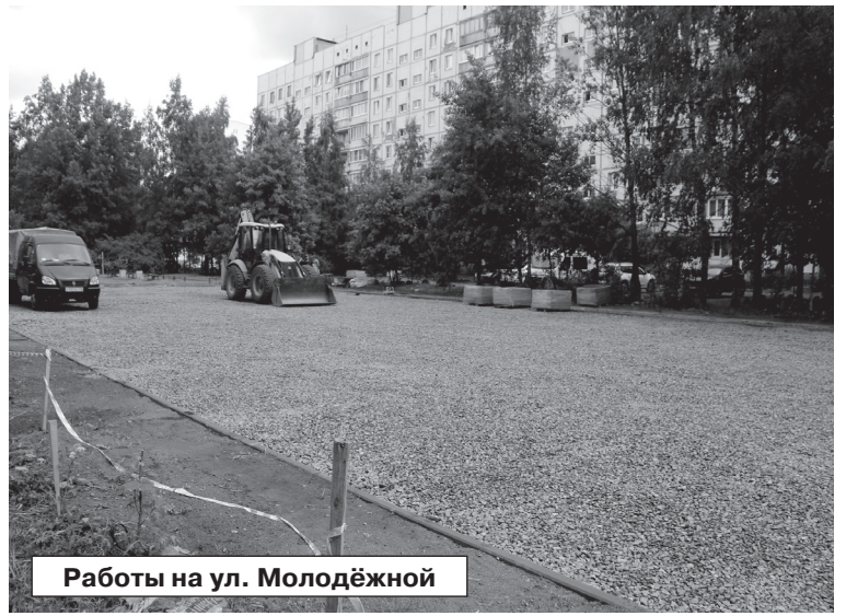
Работы на ул. Молодёжной