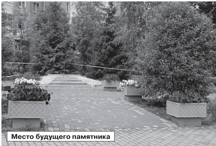
Место будущего памятника