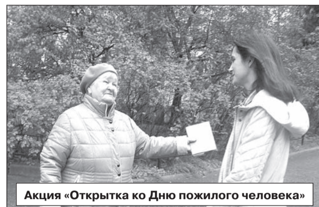
Акция «Открытка ко Дню пожилого человека»

- Да, наш девиз «Неси свет!». Нет тьмы, а