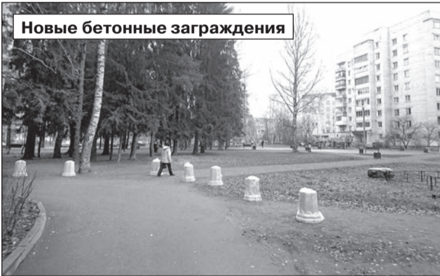
Новые бетонные ограждения

Ленинградская область получит субсидии на создание детского технопарка «Кванториум», модельного центра дополнительного образования с внедрением персонализированного финансирования. За счёт средств федеральной казны в регионе будут созданы современные центры образования, обновлены кабинеты информатики и ОБЖ, в коррекционных школах появится новое оборудование для трудовых мастерских.