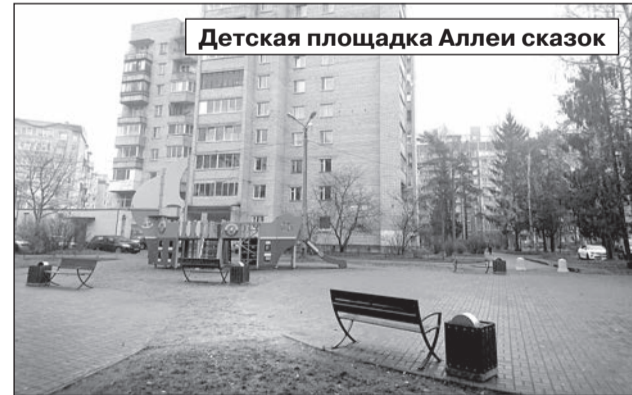
Детская площадка Аллеи сказок