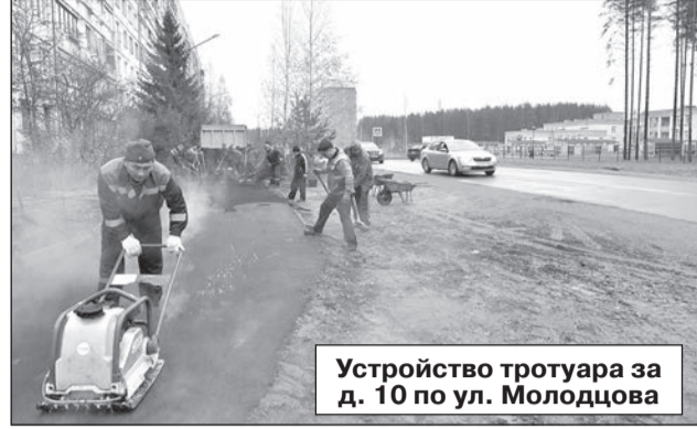
Устройство тротуара за д. 10 по ул. Молодцова