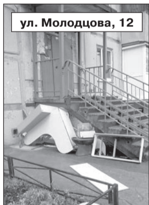
ул. Молодцова, 12

ОТВЕТСТВЕННОСТЬ ЗА ЧИСТОТУ НЕСУТ НЕ ТОЛЬКО ГОРОДСКИЕ СЛУЖБЫ