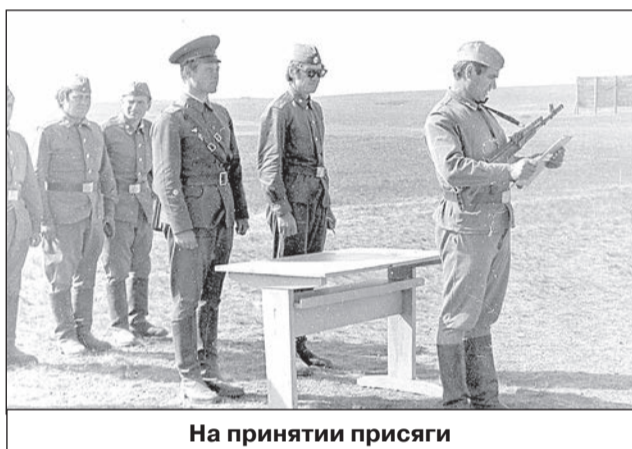
На принятии присяги