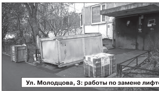
Ул. Молодцова, 3: работы по замене лифтов продолжаются