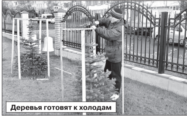
Деревья готовят к холодам