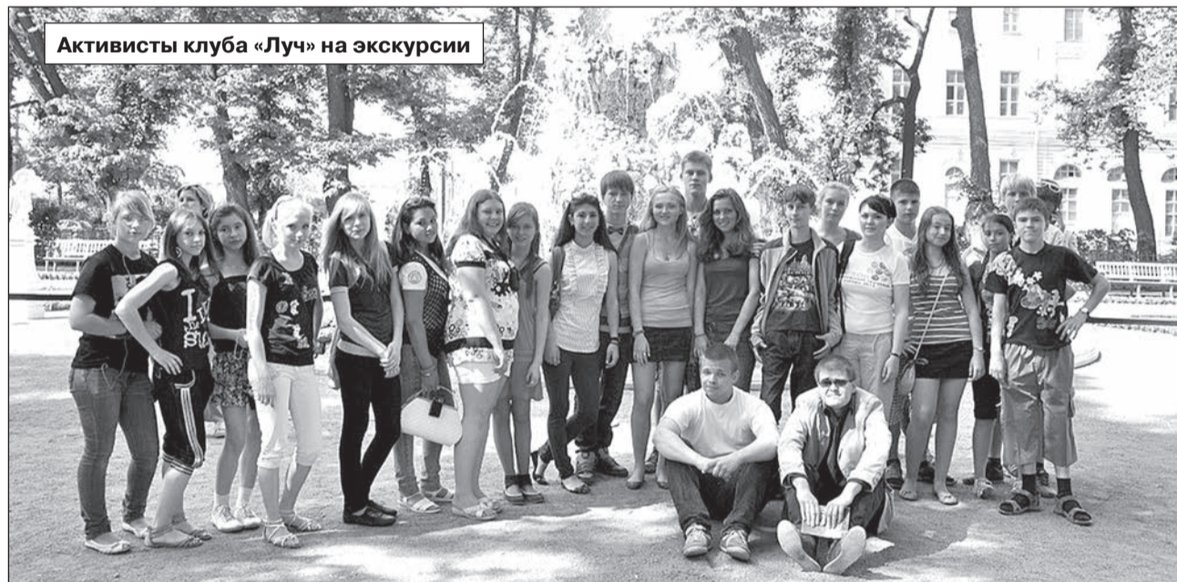
Активисты клуба «Луч» на экскурсии

Беседовала Виктория МЕЛЬНИК