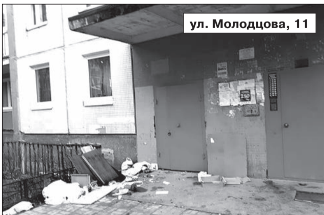
ул. Молодцова, 11

только о нарушении эстетического вида, но и о неплебательском отношении к своим соседям и чужому труду.