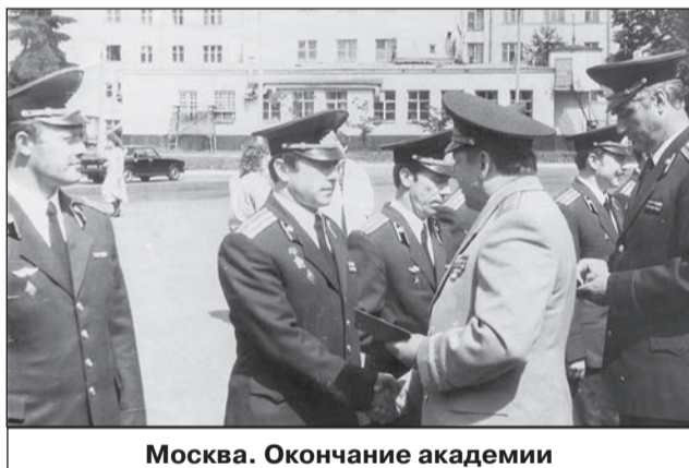
Москва. Окончание академии