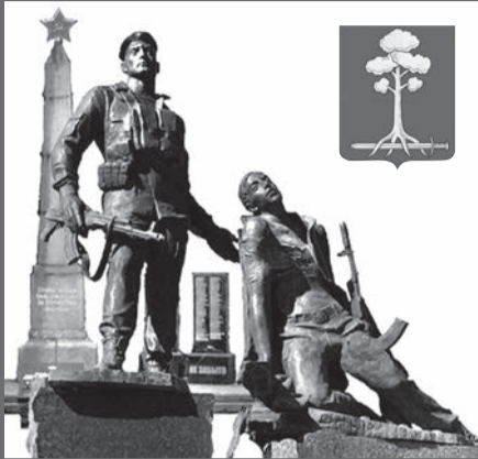
МУНИЦИПАЛЬНОЕ ОБРАЗОВАНИЕ СЕРТОЛОВО