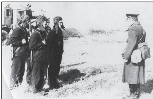
Беседа с личным составом

13 НОЯБРЯ – ДЕНЬ ОСНОВАНИЯ ВОЙСК РАДИАЦИОННОЙ, ХИМИЧЕСКОЙ И БИОЛОГИЧЕСКОЙ ЗАЩИТЫ (РХБЗ)