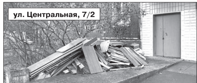
ул. Центральная, 7/2