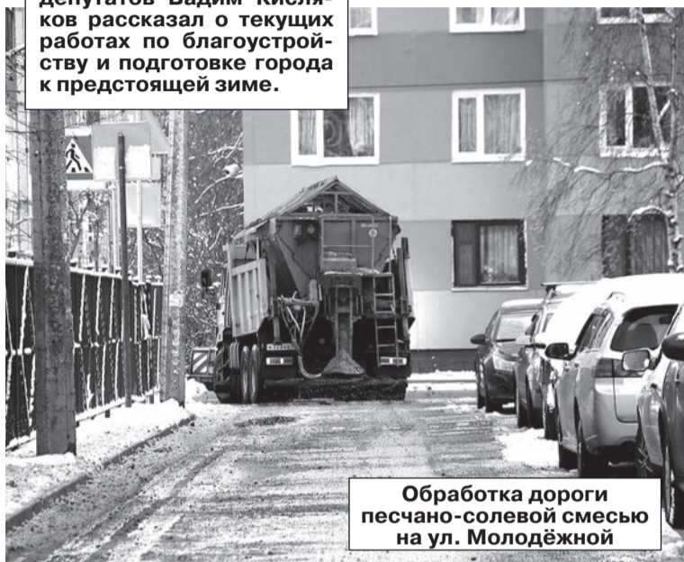
Обработка дороги песчано-солевой смесью на ул. Молодёжной