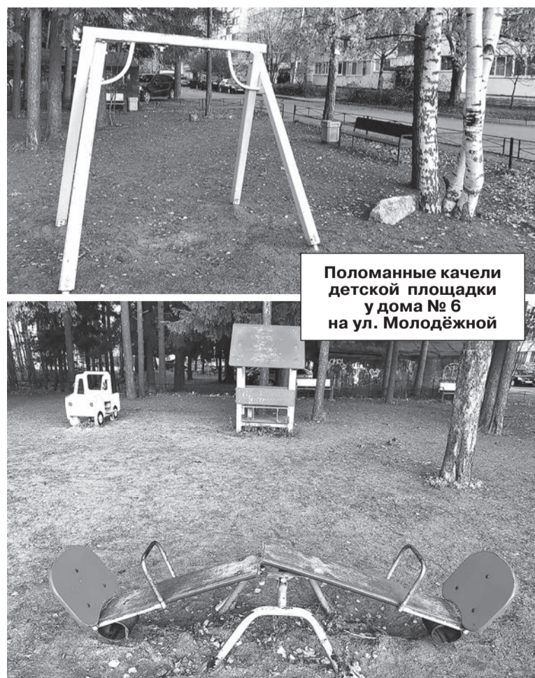
Поломанные качели детской площадки у дома №6 на ул. Молодёжной