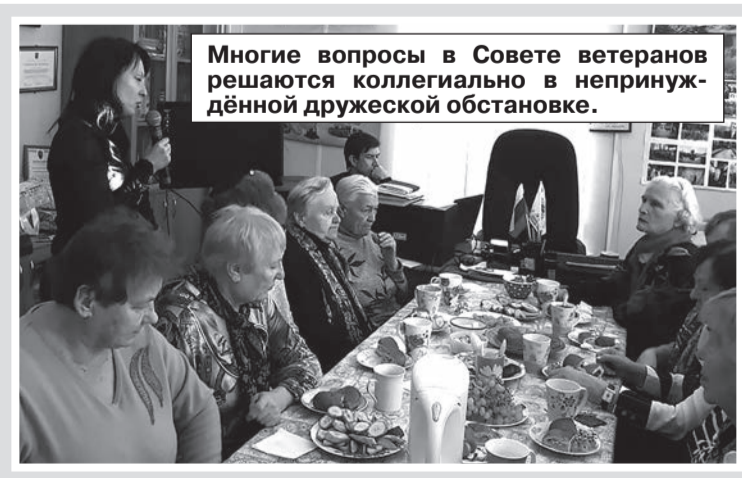
Многие вопросы в Совете ветеранов решаются коллегиально в непринуждённой дружеской обстановке.