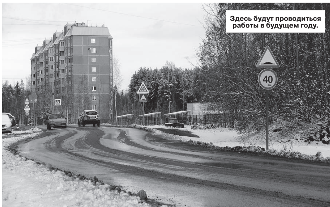
Здесь будут проводиться работы в будущем году.