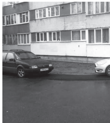
Бессовестные водители устроили парковку на тротуаре у дома №1 по ул. Молодцова

Как пример, автовладельцы, паркующие автомобили на тротуаре у дома №1 на ули-