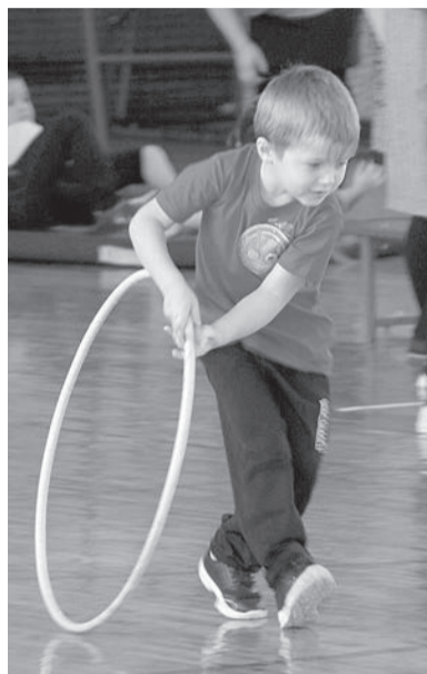
Конкурс с обручем.

В минувший четверг в спортивном зале БСОШ № 2 было оживленно как никогда. Воспитанники пяти детских садов – Баганского №2 «Солнышко», Вознесенского, Лепокуровского, Савкинского и Теренгульского, прибыли сюда для участия в районном конкурсе «Веселые старты с ГТО» среди детей 6-7 лет.