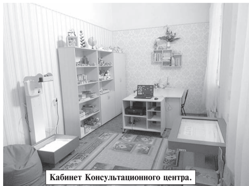
Кабинет Консультационного центра.

Посещает ли Ваш ребенок дошкольное образовательное учреждение? Если ответ «НЕТ» — эта информация для Вас!