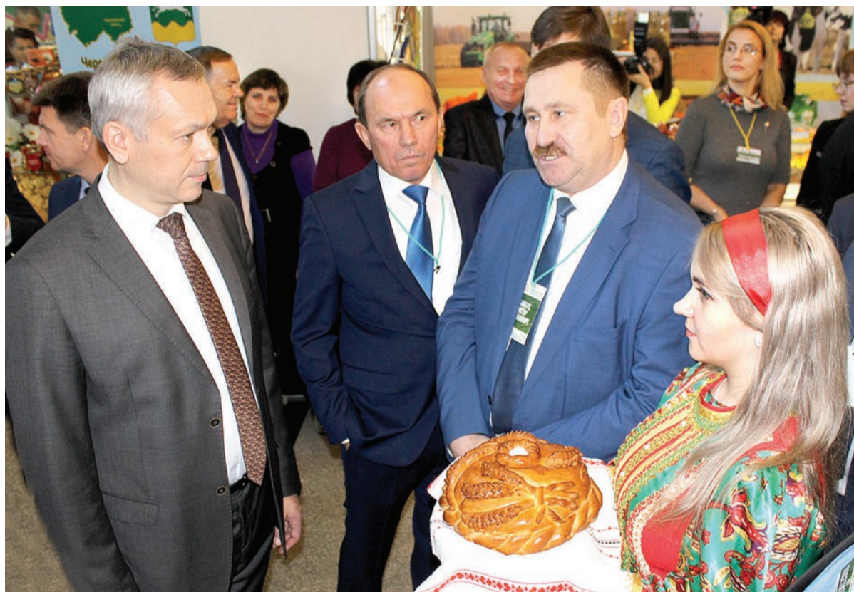
Хлеб-соль губернатору от баганцев.

27-29 ноября в г. Новосибирске прошел четвертый агропродовольственный форум, организатором которого стало правительство Новосибирской области. Делегация Баганского района была на нем одной из самых многочисленных.