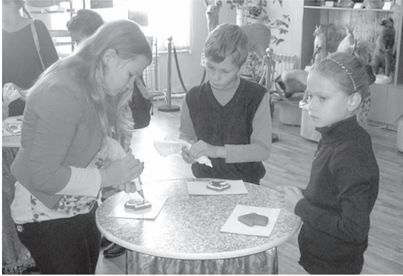
Учимся расписывать купинские пряники.

В рамках реализации регионального проекта «Успех каждого ребенка» и межрайонного сетевого взаимодействия краеведов Баганского и Купинского районов состоялась выездная экскурсия ребят-краеведов Баганского района в МБУ «Купинский районный музейно-мемориальный комплекс».