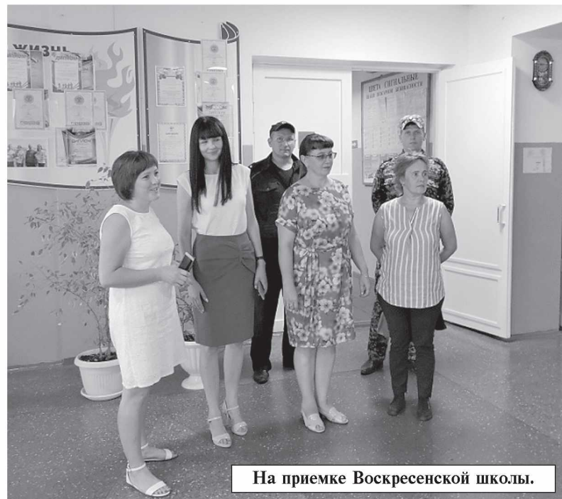
На приемке Воскресенской школы.