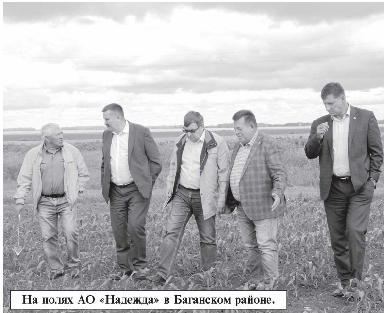
На полях АО «Надежда» в Баганском районе.

На настоящее время режим чрезвычайной ситуации природного характера введен на территории 17 муниципальных районов Новосибирской области. Сочетание почвенной и воздушной засухи привело к существенному снижению урожайности сельскохозяйственных культур на значительных территориях области и к гибели посевов на площади 195 тысяч гектаров.