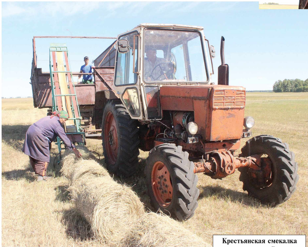
Крестьянская смекалка и напряженный труд.

Вариант ручной косовицы даже не рассматривали, ведь на стойловый период им нужно было порядка 30-40 тонн. По-