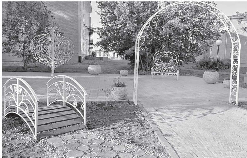
Уютный уголок для влюбленных.

Пространство семейного парка села Баган постепенно наполняется продуманными зонами и это очень дорогого стоит. Про одну из них хотелось рассказать.