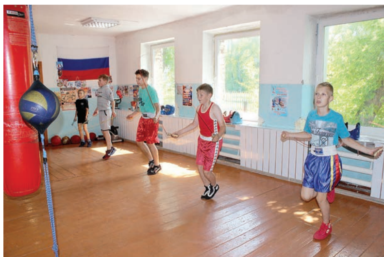
Разминка перед тренировкой.