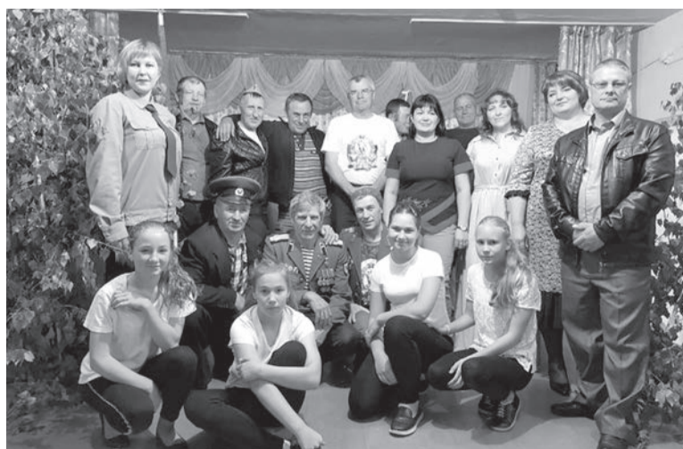
Фото на память с ветеранами ГСВГ.

По сложившейся традиции 9 июня в Теренгульском филиале КДЦ вновь собрались ветераны ГСВГ.