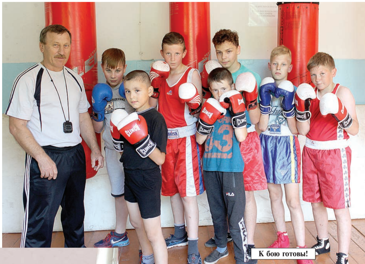
К бою готовы!

— Наверное, больше за них переживаю я. Бывают разные