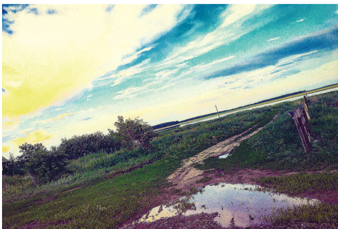
За околицей села, после дождя.

Видеть красоту там, где ее, казалось бы, нет, радоваться «тихой», неброской красоте нашего степного края, к сожалению, умеют не все. То, что природа умеет врачевать, я убеждаюсь прак-