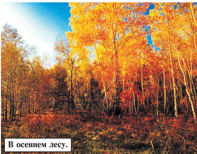
В осеннем лесу.

тически каждый день. Идешь, бывает, уставший, из школы, хочется есть, а еще больше — спать. А после обеда — консультации и куча уроков... И вот по дороге из школы я вижу парящий по ветру одинокий засохший листок, а в небе — отблески холодного зимнего солнца; деревья и провода заиндевелые, строгие, на ветке сирени сидит красивая, но незнакомая мне птичка. Я достаю телефон, фотографирую. Гигабайты памяти моего мобильного устройства заполнены такими вот чудесными моментами. Зато как легко и весело становится на душе! И уже нет усталости, а глаза открываются все шире и шире при виде окружа-