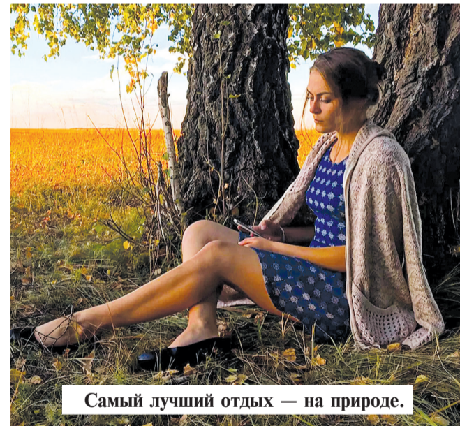
Самый лучший отдых — на природе.

тически каждый день. Идешь, бывает, уставший, из школы, хочется есть, а еще больше — спать. А после обеда — консультации и куча уроков... И вот по дороге из школы я вижу парящий по ветру одинокий засохший листок, а в небе — отблески холодного зимнего солнца; деревья и провода заиндевелые, строгие, на ветке сирени сидит красивая, но незнакомая мне птичка. Я достаю телефон, фотографирую. Гигабайты памяти моего мобильного устройства заполнены такими вот чудесными моментами. Зато как легко и весело становится на душе! И уже нет усталости, а глаза открываются все шире и шире при виде окружа-