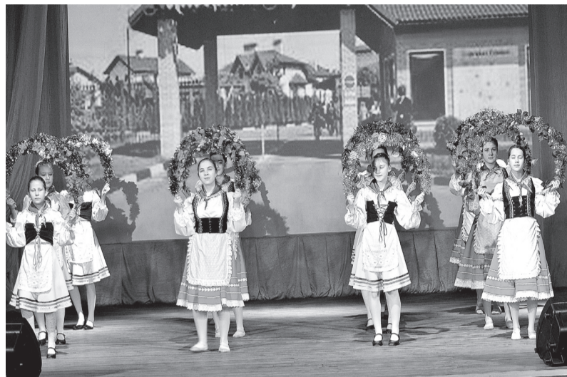
«Праздничный марш» в исполнении хореографического ансамбля «Вдохновение».

Образцовый хореографический ансамбль «Вдохновение» Дома детского творчества получил два диплома первой степени за участие в областном этапе Всероссийского фольклорного конкурса «Живая традиция».