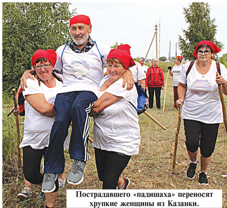
Пострадавшего «падишаха» переносят хрупкие женщины из Казанки.