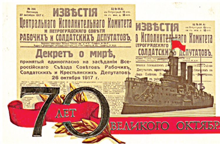
Художник М. Юдаева. Московская типография госзнака. 1987 г. Тираж — 100 тыс. экз., цена — 17 коп.

Трудно себе представить современного человека, который бы никогда не покупал или не получал открыток. До того, как Интернет и мобильная связь прочно вошли в нашу жизнь, люди имели привычку в праздники посылать открытки по почте.