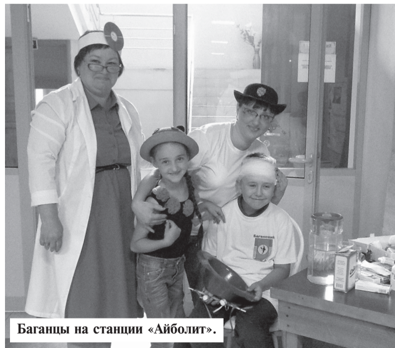
Баганцы на станции «Айболит».

Все остались довольны от проведенного фестиваля и