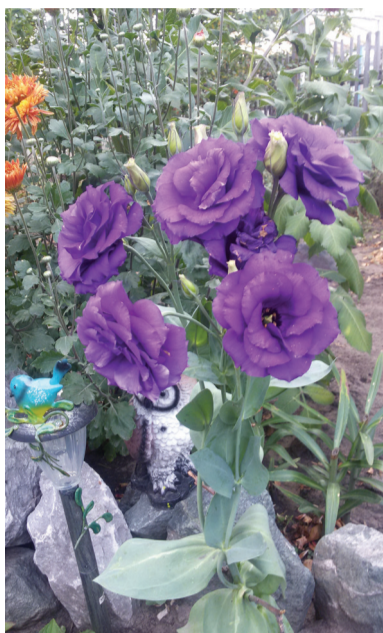
Вот она — красавица эустома!

это время находятся лишь два листочка со спичечную головку. Для того чтобы насладиться цветением в июле — августе, эустоме нужно посадить в конце февраля. Цветок этого изысканного растения очень похож на розу. Атласные лепестки собраны в крепкую розетку. Середину украшают яркие желтые глазочки. Цветы бывают разных расцветок, но мне полюбилась ярко-сиреневая красавица. А как благородна и изыскана эустома, когда раскручивает бутон! Светло-белесая зелень растения выделяется в саду и сразу привлекает внимание к себе. Это роскошное растение прекрасно в срезке. Все мои знакомые, увидевшие эустому в моем саду или на фото, в этом году пытаются вырастить ее у себя в саду. Не все и у всех сразу получается, но мы делимся опытом друг с другом и с нетерпением ждем цветения в этом году. Сейчас у меня уже семь кустов этого экзотического растения.