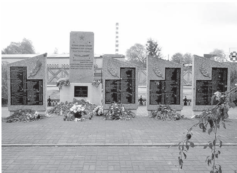
Братская могила советских воинов в Кенигсберге.