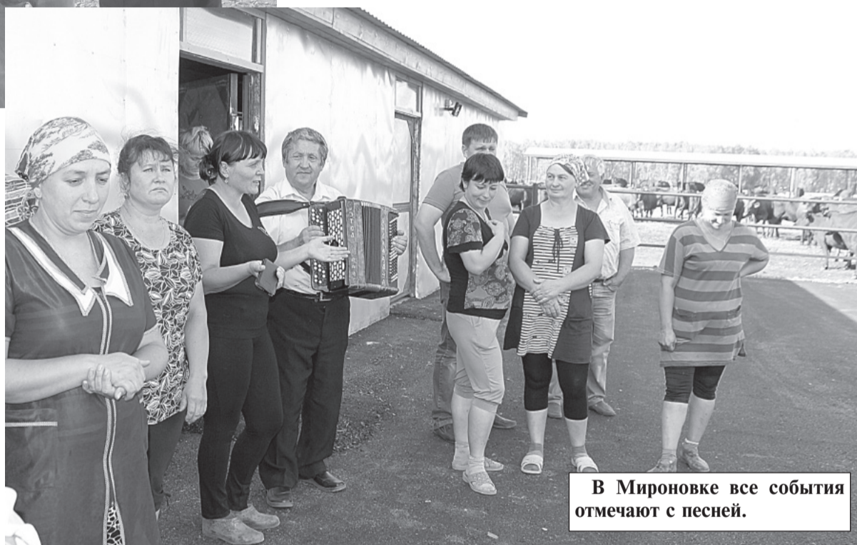
В Мироновке все события отмечают с песней.

Закончилось мероприятие шампанским. Участники художественной самодеятельности Мироновского клуба продемонстрировали гостям свое мастерство.