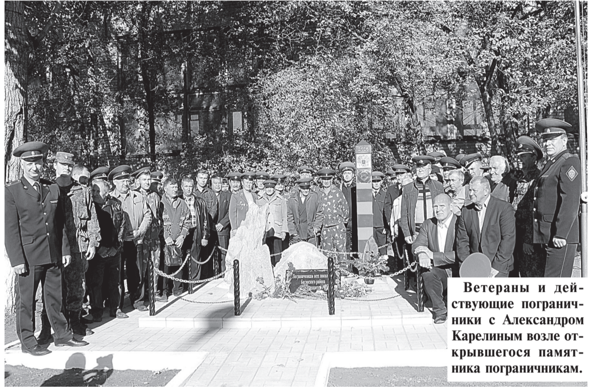
Ветераны и действующие пограничники с Александром Карелиным возле открывшегося памятника пограничникам.

В Багане возле здания спортивной школы в торжественной обстановке открыли памятник пограничникам.