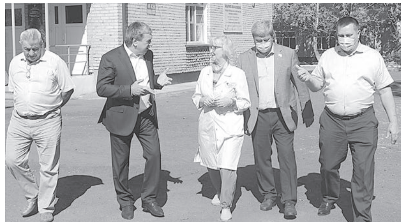
На территории ЦРБ.

В Баганской ЦРБ депутаты посетили стоматологический кабинет, который нуждается в современном оборудовании и детском отделении, где уже начат первый этап глобальной реконструкции.