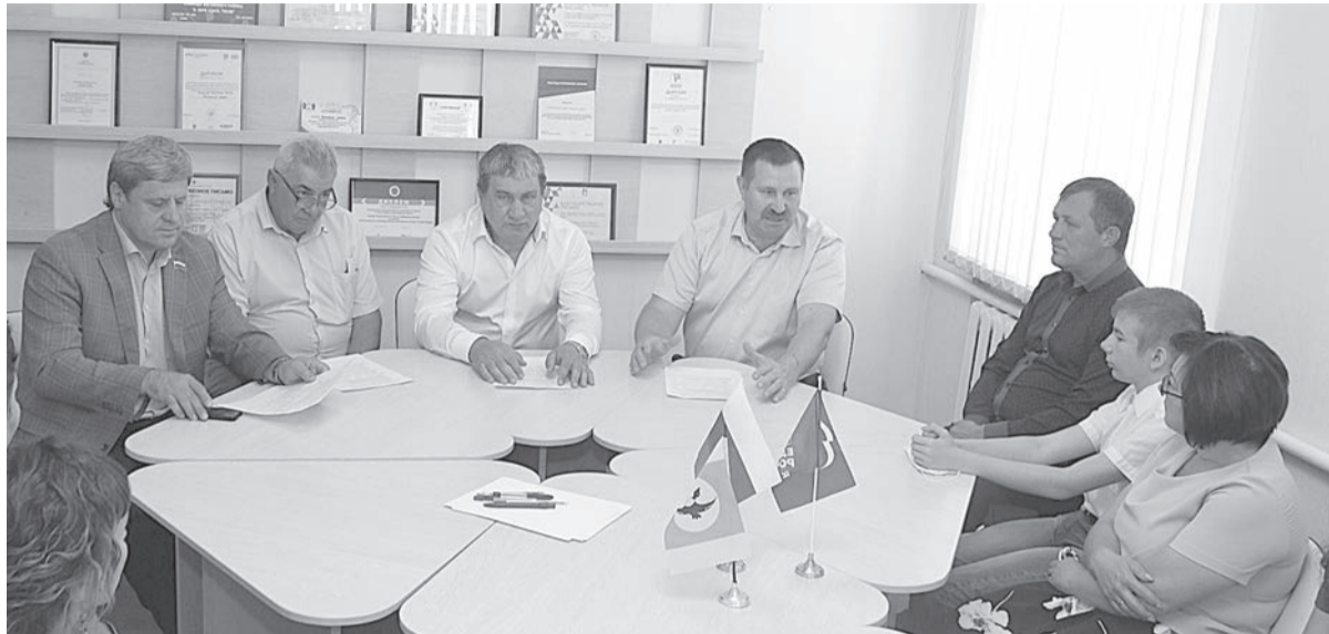
На встрече в молодежном центре.

На днях наш район с рабочим визитом посетили депутаты Законодательного Собрания Новосибирской области Александр Кулинич и Александр Терепя.