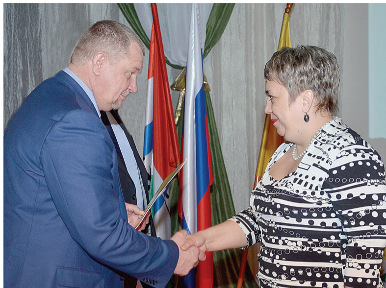
В 2014 году выделено 19 земельных участков под индивидуальное строительство, 9 из них — в Ивановке. Капитально отремонтировалась улично-дорожная сеть, сделан текущий ремонт в целом ряде социально-культурных объектов. Приняты меры для улучшения качества работы медицинских, общеобразовательных, культурных и спортивных учреждений.

Успешно решаются в районе социальные вопросы. Введено 2430,3 квадратных метра жилья. Обеспечение жильем при бюджетной поддержке осуществлялось, прежде всего, молодых семей и граждан, проживающих в сельской местности, ветеранов