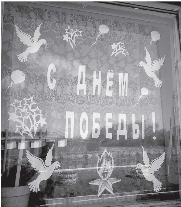
Тычкинский сельский клуб.