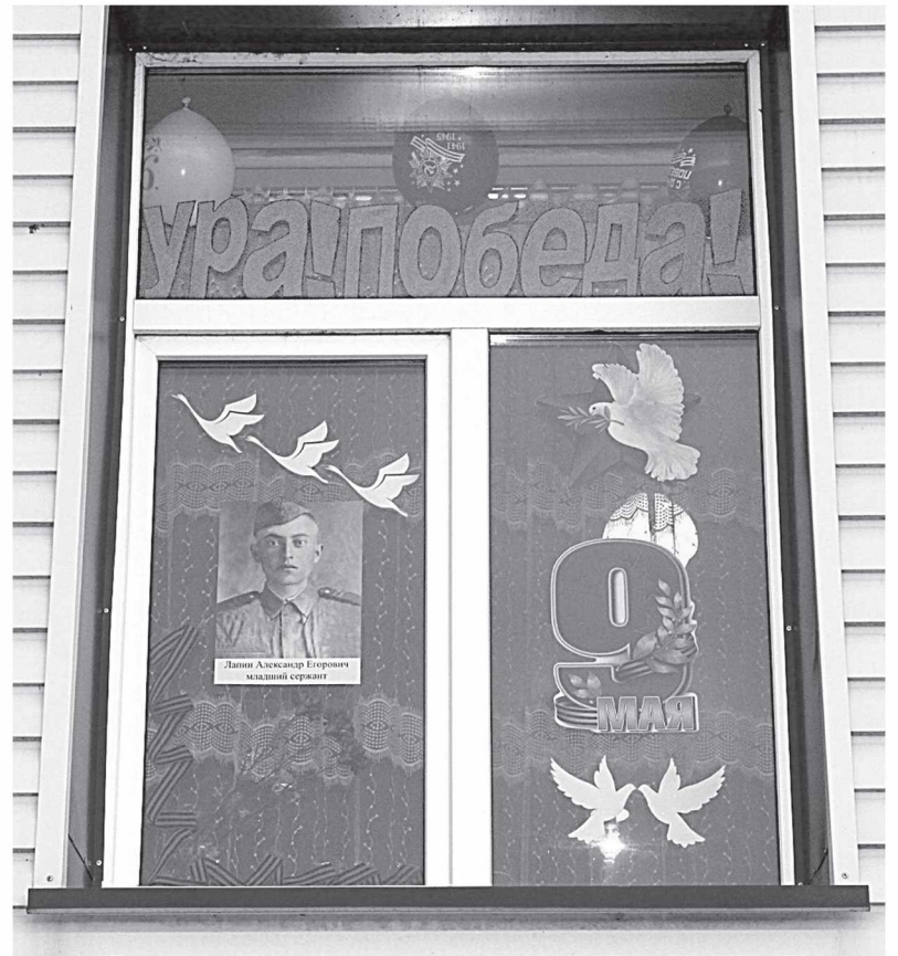
«Окно Победы» газеты «Степная нива».