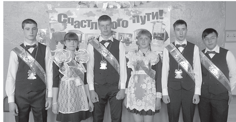
Выпускники 2015 года.