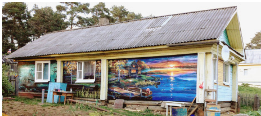
Разрисованный дом привлекает внимание и восхищает своей красотой и оригинальностью.