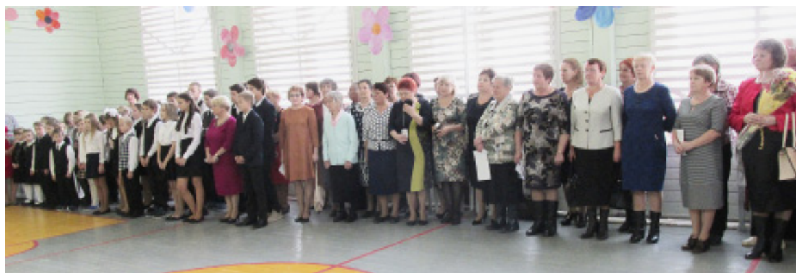
На торжественной линейке...