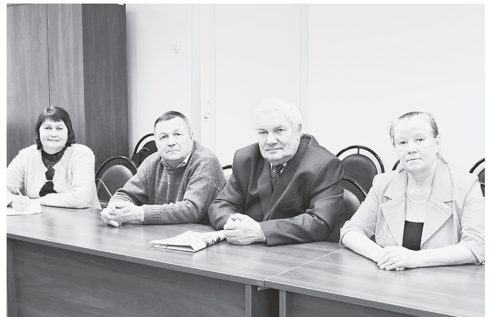
Двадцать второго февраля состоялось заседание Общественного совета Сямженского района по подготовке к проведению выборов Президента РФ на территории муниципалитета.

В соответствии с Федеральным законом от 5 декабря 2017 года № 374-ФЗ "О внесении изменений в Федеральный закон "О выборах Президента Российской Федерации" правом назначать наблюдателей над работой избирательных комиссий были наделены Общественные палаты субъектов РФ. Ранее подобным правом обладали только зарегистрированные кандидаты и их доверенные лица, а также политические партии, выдвинувшие зарегистрированных кандидатов.