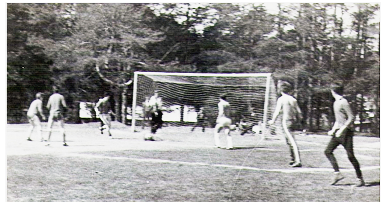
Во время матчей на "старом стадионе", 80-е.