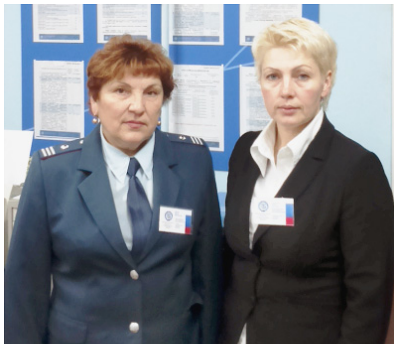
Сотрудники отдела регистрации, учета и работы с налогоплательщиками.