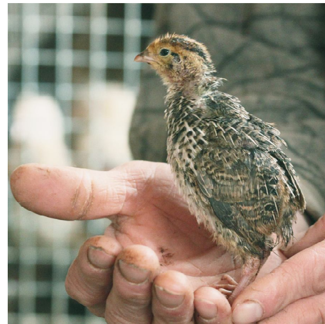
Этот молодой перепел комфортно чувствует себя в хозяйских ладонях.