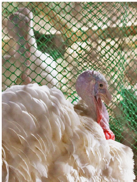
Индюк белой широкогрудой породы.