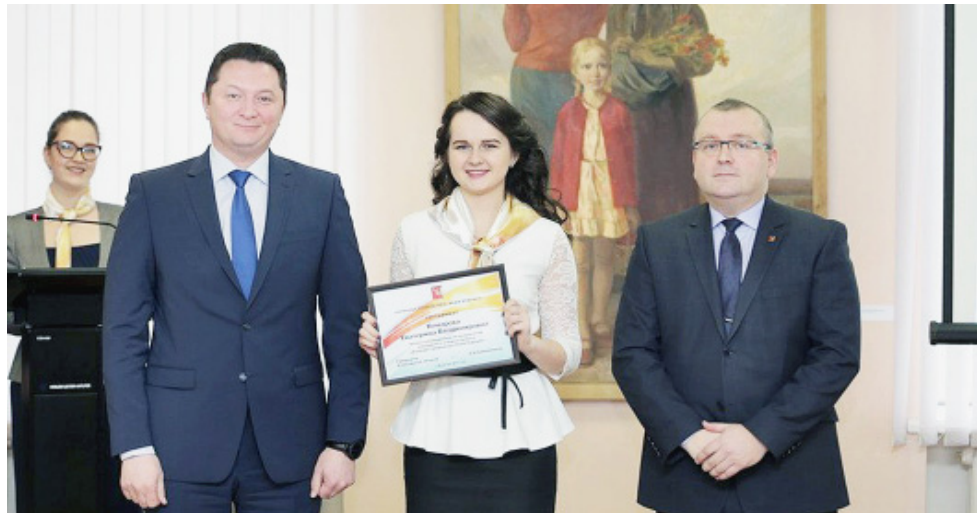
Материал подготовлен при поддержке Управления информационной политики Правительства Вологодской области.