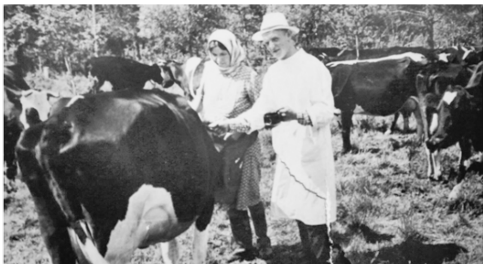
В годы работы в колхозе «Первое мая».

Дорогого мужа и папу, любимого дедушку поздравляем с Юбилеем! Наш самый любимый!