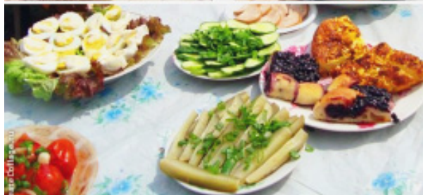
Вот такую вкуснятину можно было отвесть на празднике.

У маленьких российских деревень похожая судьба, но живут в них люди по-разному: где-то каждый сам по себе, а где-то большой дружной семьей, искренне переживая друг за друга, разделяя и горести, и радость. И даже дачники, живущие в деревне в определенном сезоне, чувствуют себя здесь как дома.