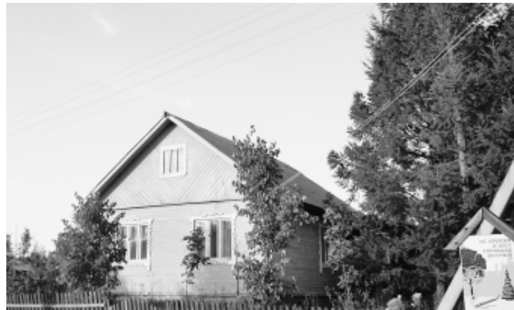
Контора Верденгского лесничества.