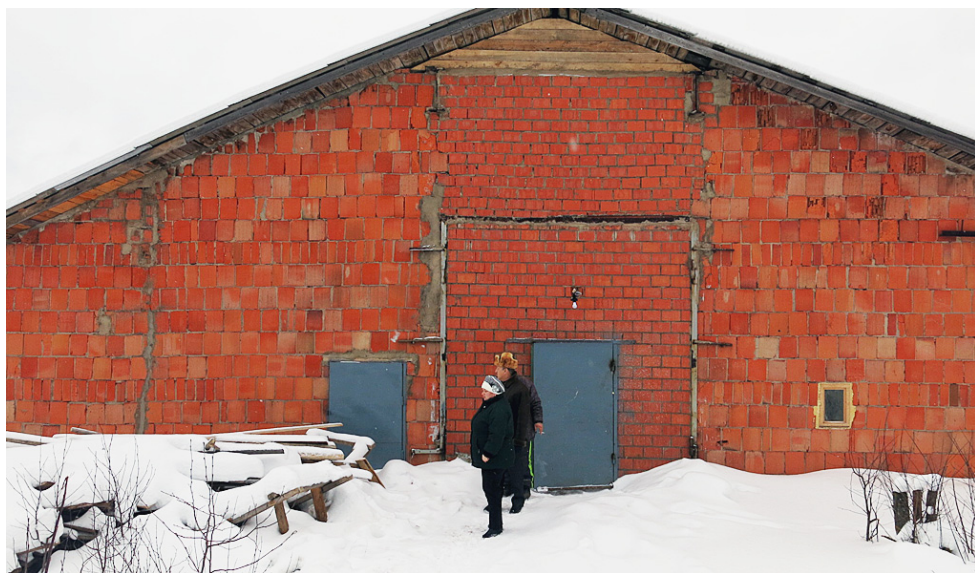
Реконструированное здание фермы в Шокши.