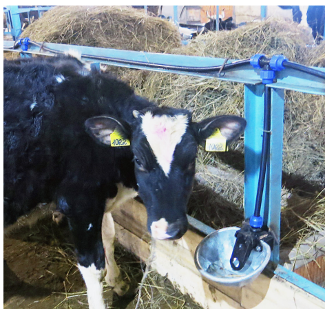
Новые "жилыцы" содержатся в комфортных условиях.

фермы бычки добирались на грузовых автомашинах "Газель" и "Валдай". В настоящее время в помещении содержится 154 головы крупного рогатого скота. Совсем скоро к этому рогатому семейству добавится еще 46 бычков, молодняка в возрасте старше месяца. Фермер предпочитает начинать откорм именно с этого периода, когда животное уже самостоятельно может питаться твердыми кормами. Для новых жителей оборудованы специальные клетки, расположенные в среднем ряду. Это позволит им всегда находиться в тепле. Уходом за животными занимаются три человека. Обеспечивая занятость работникам, глава КФХ несет еще и социальную миссию.