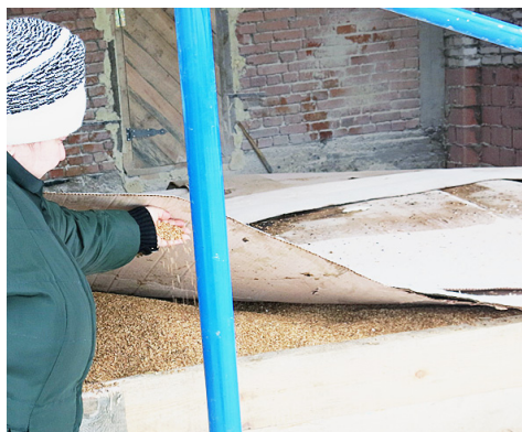
На ферме есть необходимый запас зернофуража