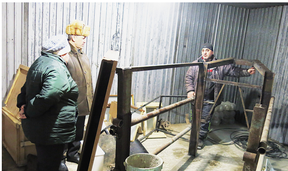
Будущая убойная площадка.

необходимого объема работ и положительное заключение экспертизы по данным мероприятиям уже имеются.