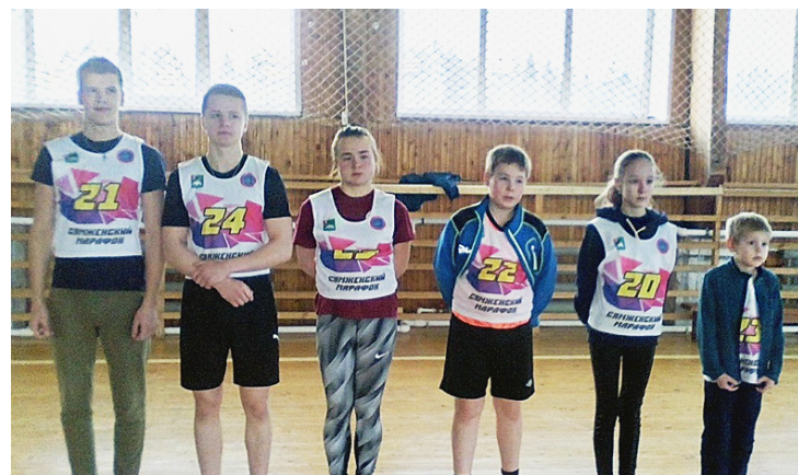
Участники "Зимнего фестиваля ГТО".

Подготовила Татьяна МОРОЗОВА.