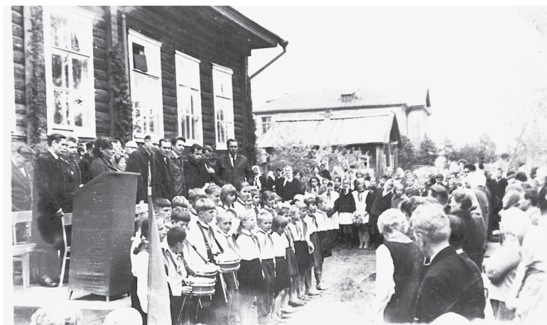
Приветствие пионеров на торжественном собрании, посвященном дню 50-летия школы.