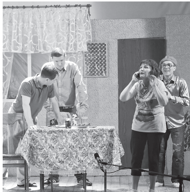
Сцена из спектакля «Семейный детектив».