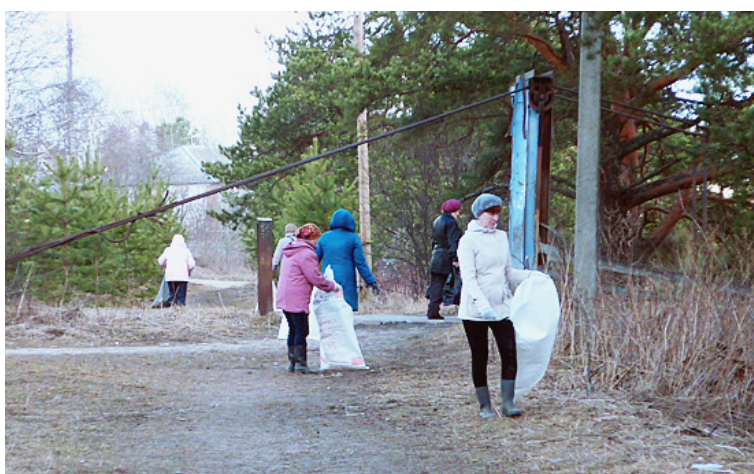
На уборке прибрежной полосы реки Сямжены.

Участниками генеральных уборок стали 217 человек - жителей сельских поселений Сямженское, Раменское, Ногинское, было задействовано 10 единиц техники. Работники территориального отдела - государственного лесничества провели уборку места отдыха у Трубаковского ключика (Ногинское поселение) и прилегающей к нему лесной полосы. В ходе подготовки к празднованию 72-ой годовщины Победы в Великой Отечественной войне во всех поселениях района у памятников, погибшим воинам-землякам, были проведены мероприятия по благоустройству: ремонт и покраска памятников и ограждений, уборка мусора, посадка цветов и деревьев.