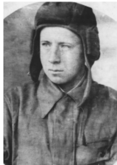
Служба в Красной Армии. 1938 год.

С удовольствием занимался огородничеством, садоводством (в деревне звали "вторым Мичуриним") и пчеловод-