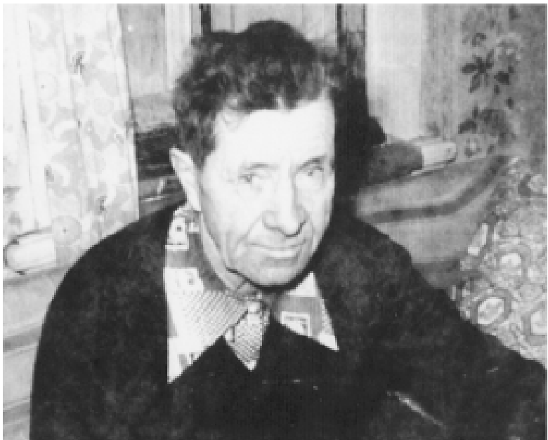
Мирное время. 90-е годы.

В этом году наша страна будет отмечать 70-летие со дня начала Великой Отечественной войны 1941-1945 годов. В преддверии этого значимого события мы всё чаще вспоминаем безмерный подвиг наших отцов и дедов.