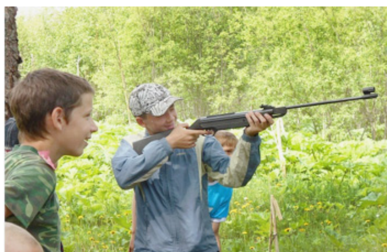
Станция "Меткий стрелок".