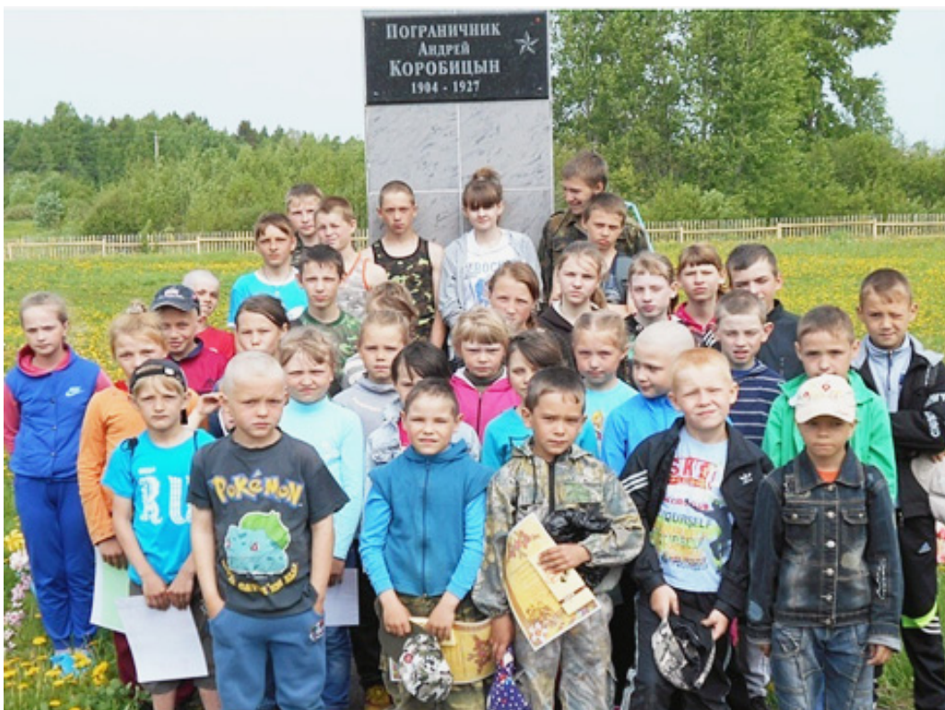
Участники игры «Зарница».