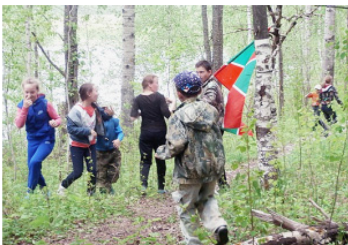
В поисках карты.