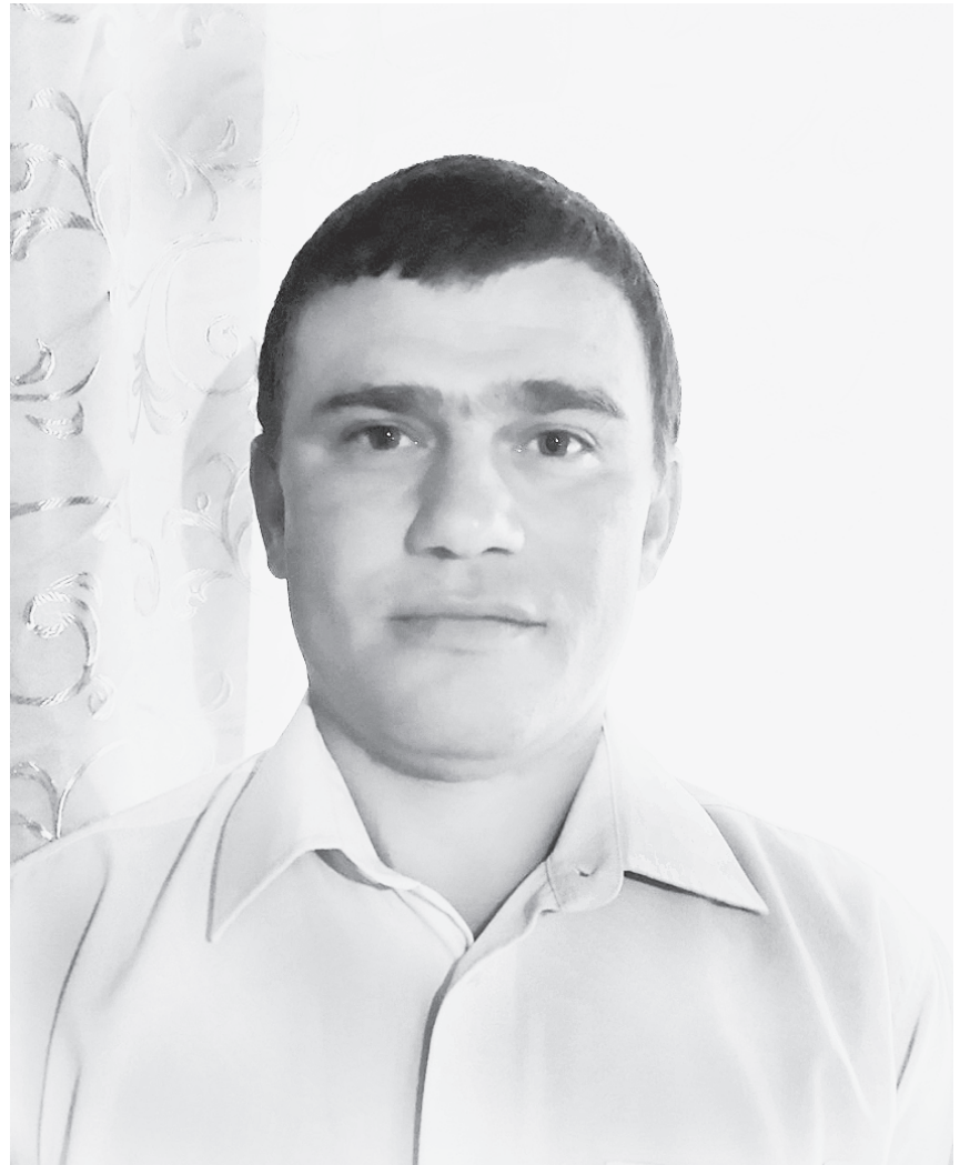
Материал предоставлен Е.Ю. Мякичевым, зарегистрированным кандидатом на должность главы сельского поселения Раменское Сямженского муниципального района, опубликован на бесплатной основе.