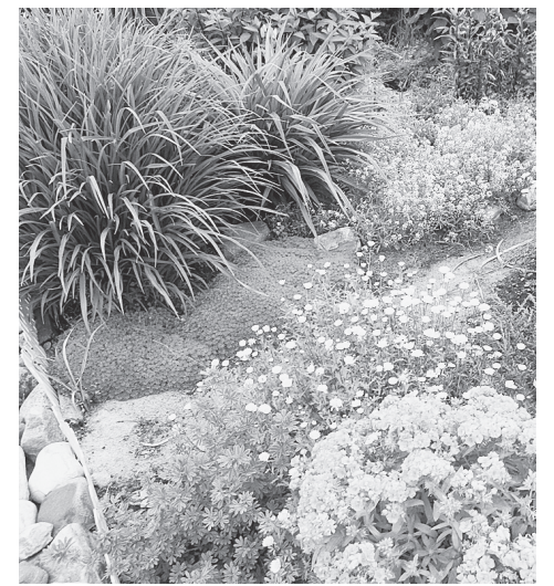
Личная усадьба - райский уголок.