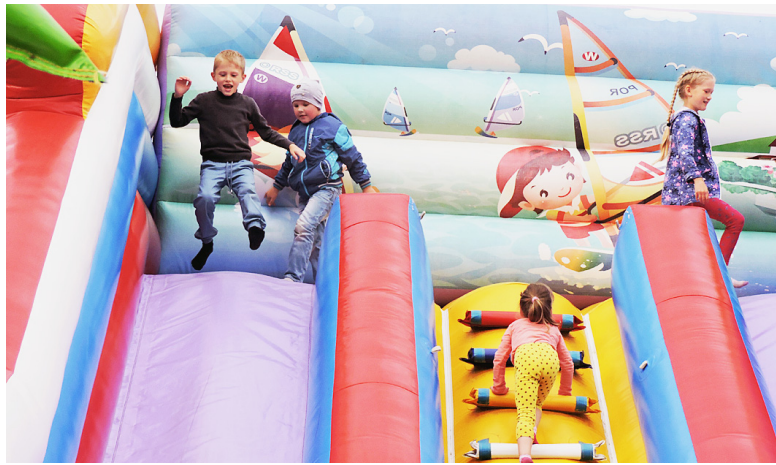
Для детей были установлены батуты.