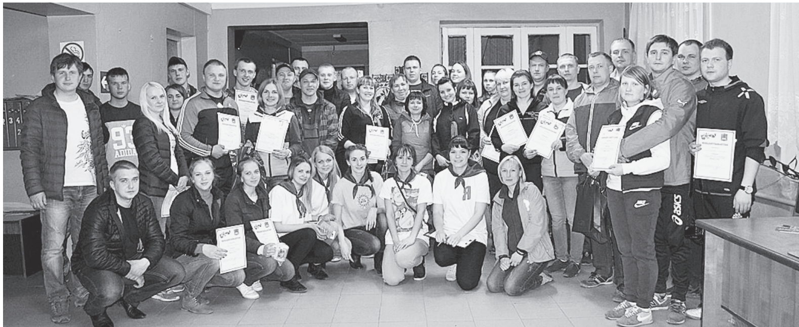
Участники 2016 года.

К печати подготовила Ирина МАКАРОВА.