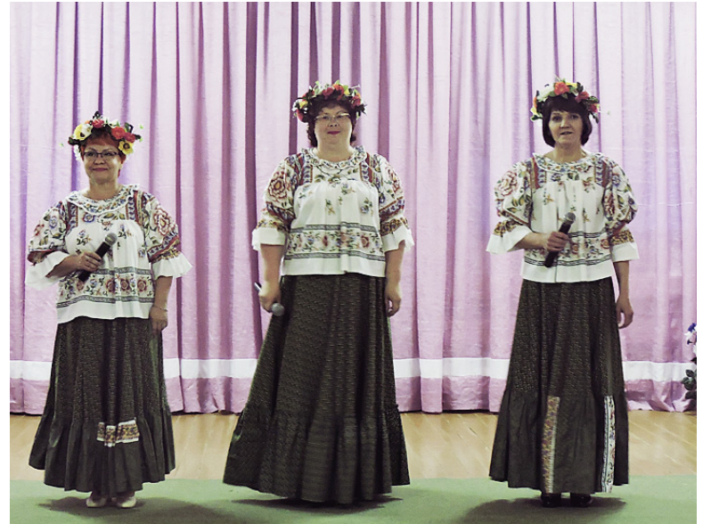
Открыли вечер солистки вокального трио "Напевы".