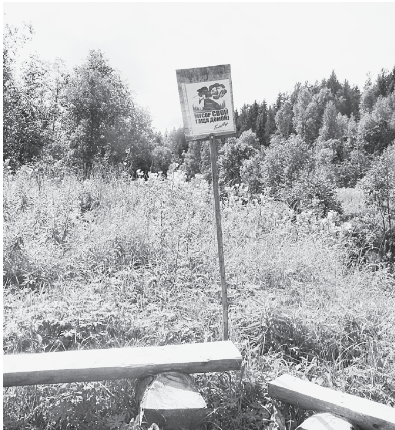
Место отдыха на берегу реки.