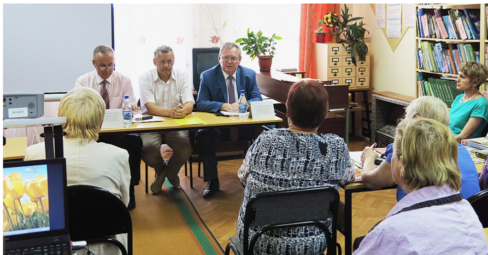
Мероприятие с участием ветеранов подобного формата проводится на территории Вологодской области впервые.

Ветераны согласились с важностью проведения подобных мероприятий и попросили при следующей встрече обсудить темы оформления завещания, наследства, составления договора дарения и другие вопросы правового характера,