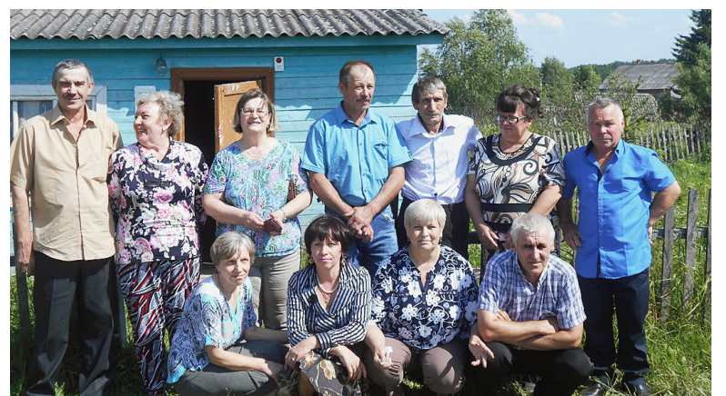
Выпускники 1977 г.

они остались девушками и юношами. Одиннадцать выпускников, пришедшие и приехавшие на встречу, окунулись в школьные годы. Радость воспоминаний заглянула в глаза, разбредила душу. Каждый подумал: "Да, мы еще молоды, красивы и на многое способны". Говорили о том, что время пролетело незаметно, что будто еще вчера они сидели за партой и мечтали поскорее повзрослеть... Ну а теперь хотелось другого: хоть на денек вернуть беззаботные школьные