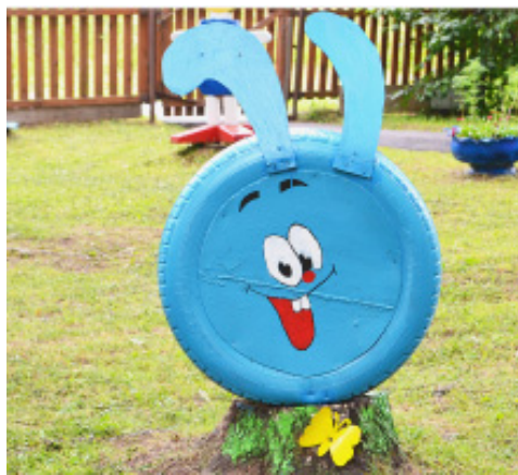
Участок второй младшей группы - самый приветливый.

Общеизвестно, что человеческая фантазия безгранична, поэтому описание всех воплощённых идей сложно поместить в рамки газетного материала, ведь, как говорится - лучше один раз увидеть, чем сто раз услышать. Отмечу лишь, что территории для прогулок всех возрастных групп при схожести отдельно взятых элементов имеют свои "изюминки". Так, например, малышей из первой младшей группы на прогулке встретят сидящие на завалинке домика бабушка с дедушкой, а с цифрами воспитанники познакомятся благодаря игре в классики из разноцветных древесных спилов. Старичок-лесовичок "расскажет" ребятам из второй младшей группы о лесе и его обитателях, весёлые смешарики настроят на позитивный лад, а украшающие деревья яркие божьи коровки зимой превратятся в мишени для метания снежков.