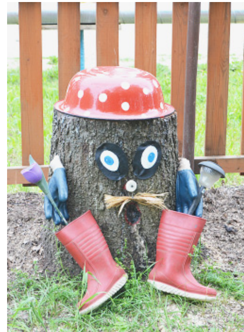
Лесовичок раскроет тайны леса...