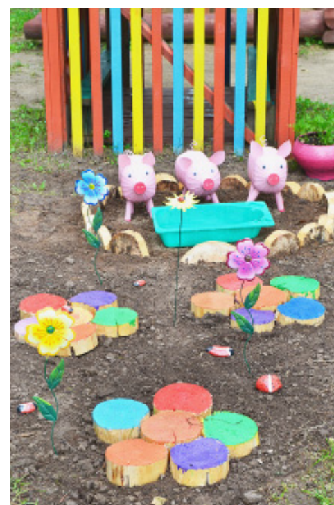
Подворье средней группы.