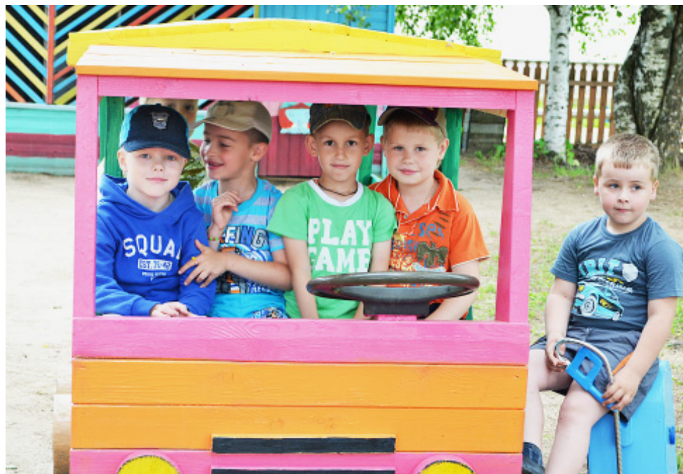
Мальчишки из подготовительной группы «облюбовали» новый автомобиль.