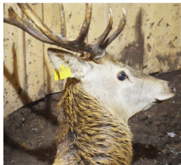
Забор анализов крови у оленей сотрудниками районной станции по борьбе с болезнями животных.

ООО "Георгиевское", расположенное на территории Коробицынского сельского поселения является первым и на сегодняшний день единственным крупным сельскохозяйственным предприятием Вологодской области, которое занимается разведением и содержанием благородного европейского оленя.