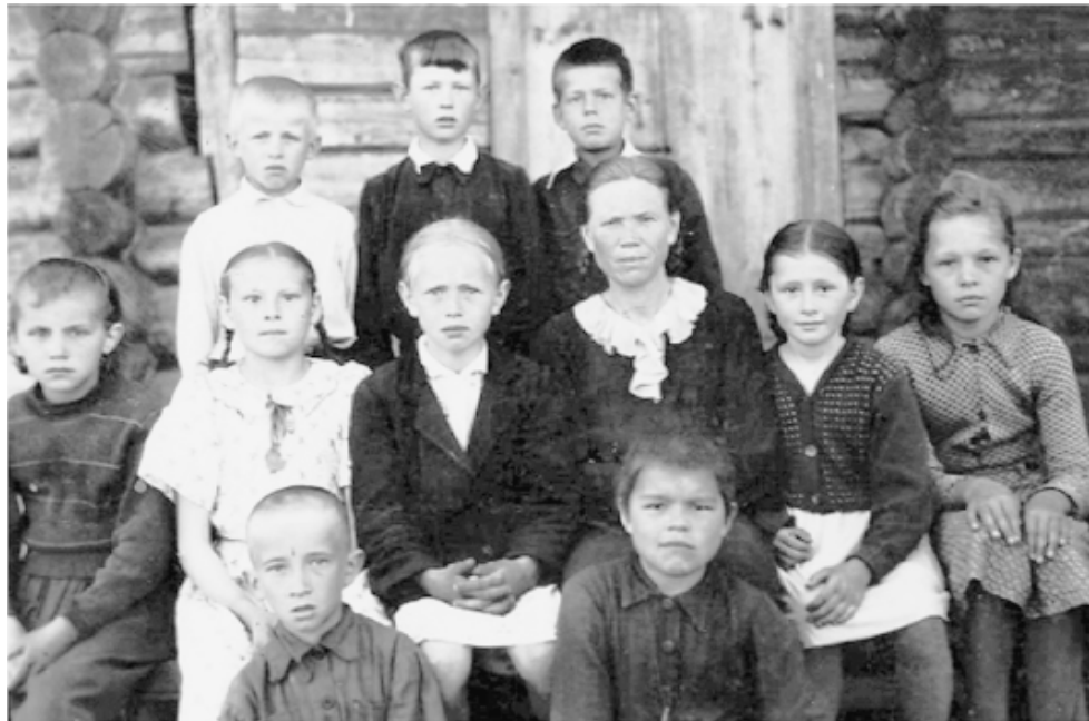
Учащиеся первого-третьего классов Высоковской начальной школы.

Ида БАРАНОВА.