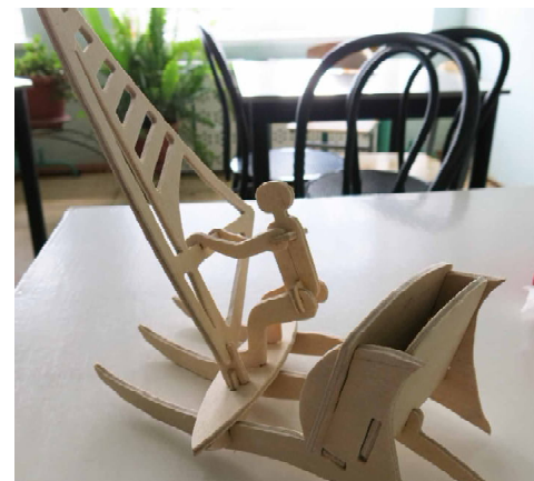
Парусник, выпиленный из дерева.