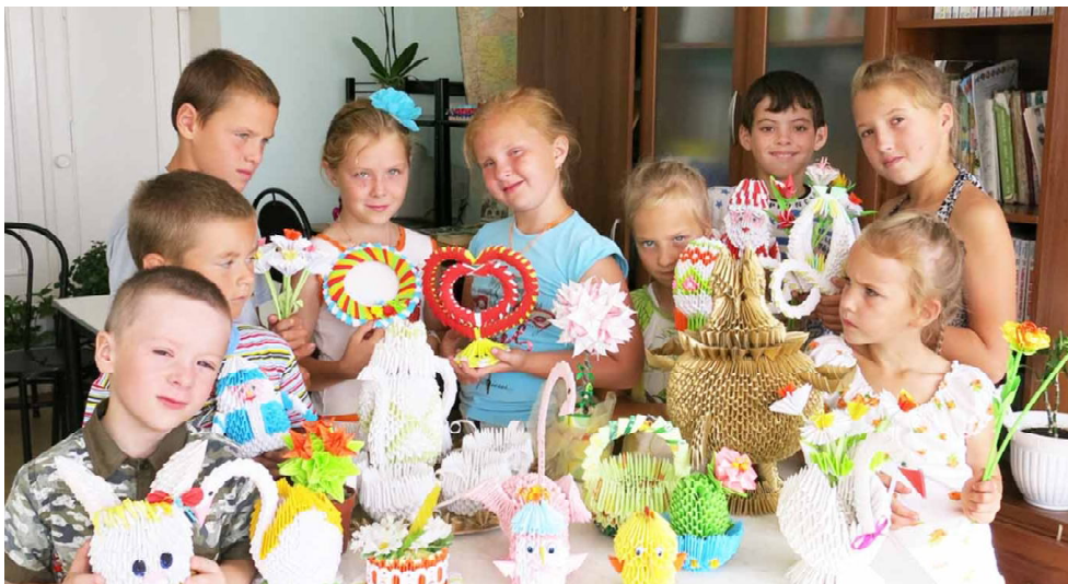
Вот такие мы мастера.

Так уж устроен человек, что создавая что-то своими руками, испытывает гордость, чувство удовлетворения от своей значимости. Вдвойне радуется, если кого-то обучит своему ремеслу и видит творение рук своих учеников.