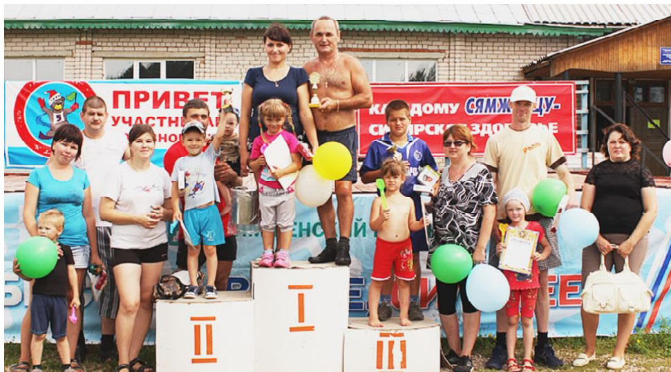
Победители и участники соревнований.

К сожалению, пришло время и "Финальной эстафеты", после которой жюри подвело итоги. Все команды показали себя как сплоченные, дружные, а главное - спортивные. Третье место заняла команда "Боксеры", второе досталось команде "Любовь к спорту", а "Дружная семья" проявила себя во всех конкурсах на высшем уровне - первое место. Никто из участников не остал-