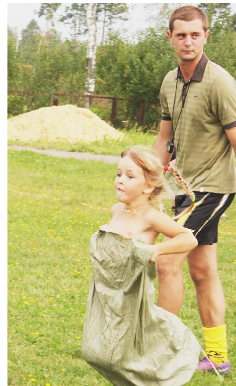
Прыжки в мешке.