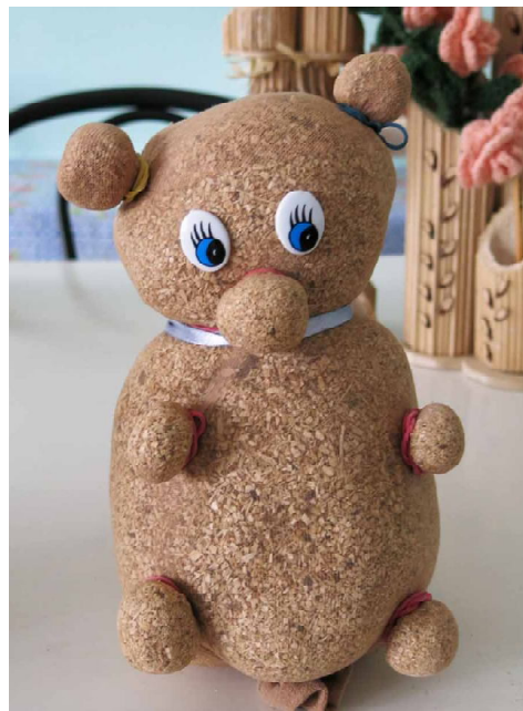
«Я - Мишка, а внутри у меня - опилки».

выставке от социально-реабилитационного центра "Солнышко" и ждут покупателей.