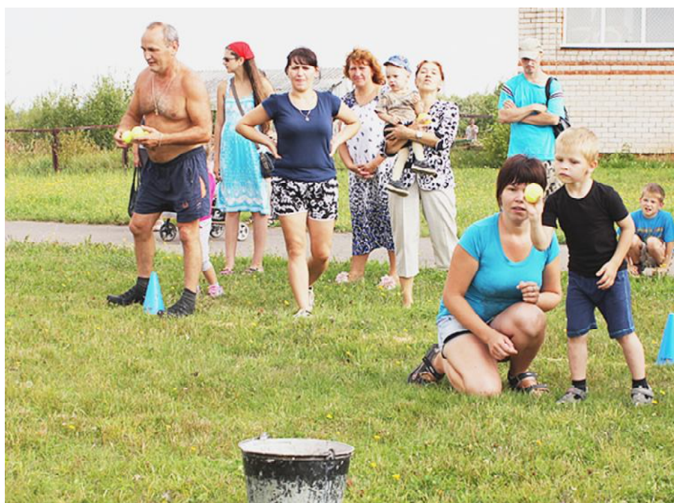
Эстафета метателей. Кто ловчее?