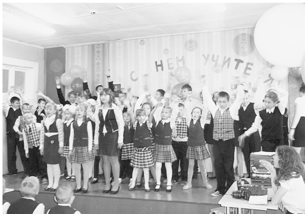
Вариант современной школьной формы.

В Сямженской средней школе с первого сентября текущего года по решению общешкольного родительского собрания и педагогического совета введена школьная форма. В соответствии с положением школьной формы является обязательной для всех учеников, и носить её необходимо ежедневно. Но не все ученики выполняют данное правило, и поэтому совет старшеклассников решил объявить необычный конкурс