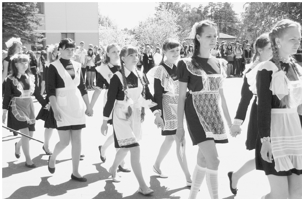
Реставрация формы советских времён.

Комфортная и удобная школьная форма, сшитая из натуральных и безопасных материалов, является залогом, прежде всего, сохранения здоровья учащихся, а также решения социальных проблем, формирует позитивный настрой, психологически спокойное состояние и активизирует желание учиться.