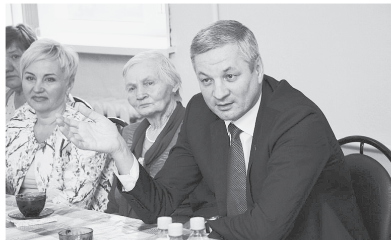
На встрече с ветеранами.

Общественные лидеры озвучили председателю ЗСО две проблемы в муниципалитете, связанные с заготовкой и учетом леса. Во-первых, это так называемые "белые пятна" - заросшие деловой древесиной сельхозземли. Они не учтены в лесном фонде, поэтому "черные лесорубы" могут практически безнаказанно