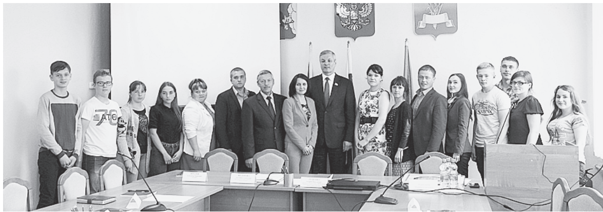
С молодыми парламентариями района.