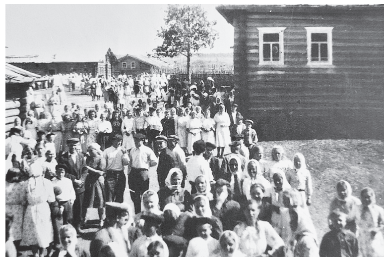
Медосьеv день, 1949 год.

мечать в честь Медосия - покровителя домашних животных после того, как в деревне случился массовый падеж скота. В честь святого Медосия в центре деревни была построена часовня, в которой проходили службы. Каждое воскресенье люди ходили молиться богу, чтобы их скот был здоровым. Часовня была украшена как изнутри, так и снаружи. При входе в часовню, под потолком, висел образ Медосия - деда с длинной бородой и доброжелательным старческим лицом. Медосьеv день отмечался пятого июля. Народу собиралось так много, что все улицы, дороги, открытые места были заполнены людьми. Приезжали гости из Шелот, Жара, Сондоги, Режи. Устраивали игры между молодыми парнями и девушками, была организована торговля. Игра гармошек, пение песен было слышно далеко.