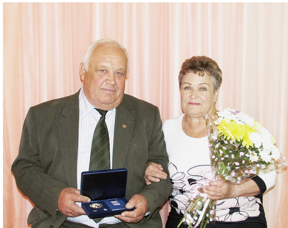
Почётная награда - медаль «За любовь и верность».