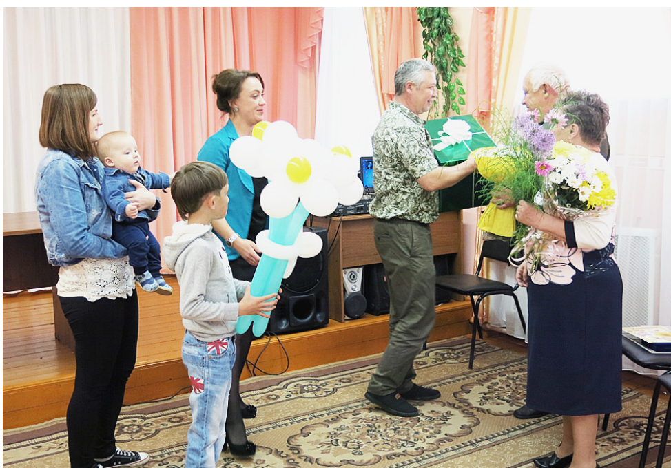
Поздравления родных и близких не оставили никого равнодушными.