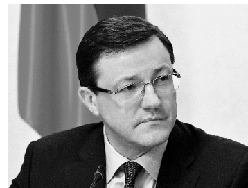
ДМИТРИЙ АЗАРОВ, губернатор Самарской области:

Представители Тольятти рассказали, что эпидемиологический порог по ОРВИ среди