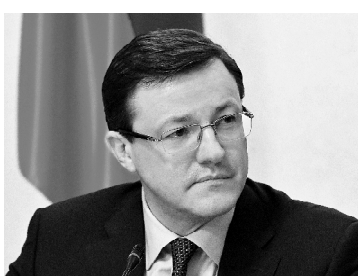
ДМИТРИЙ АЗАРОВ, губернатор Самарской области:

- На фоне пандемии общее напряжение в обществе достаточно высокое. Подобная эпидемиологическая ситуация у нас наблюдается впервые, она многим непонятна. Люди переживают, не знают, что делать и