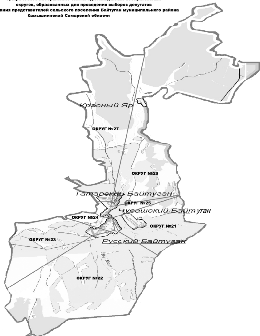
Графическое изображение схемы одномандатных избирательных округов, образованных для проведения выборов депутатов Собрания представителей сельского поселения Байтуган муниципального района Камышлинский Самарской области