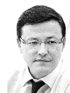
Дмитрий АЗАРОВ, губернатор Самарской области: