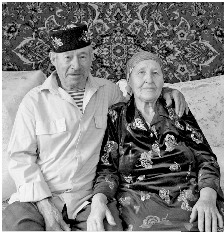
“Иңне-иңгә терәп, житәкләшеп гомер сукмакларын үттек без”

Шулай итеп, Кызыл яр поселкысында безнең яңа тормыш башланды. Дөрөс, йорт-жир бар, өй дә әйбәт, ичт-тә бар. Ашарга пеше-