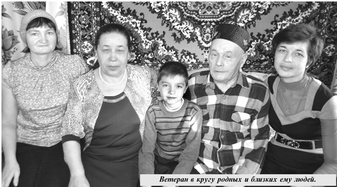
Ветеран в кругу родных и близких ему людей.