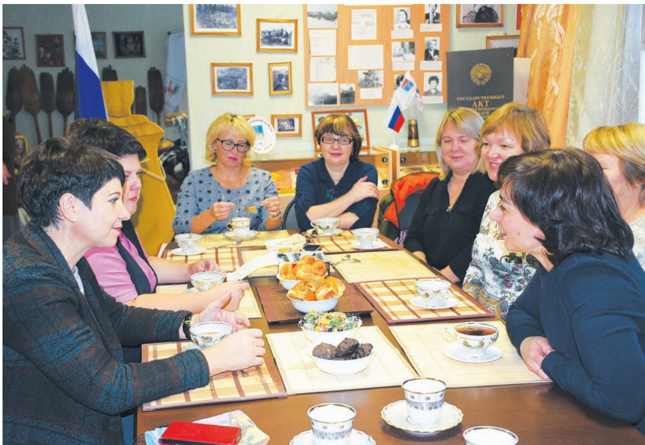
«Как там у вас, на Кубани?»