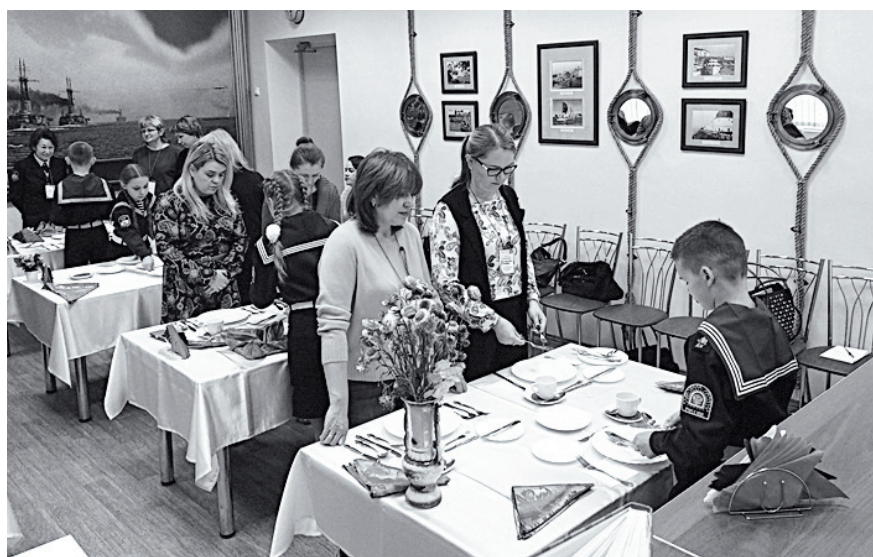
Мастер-класс по сервировке стола от шестиклассников морского кадетского корпуса