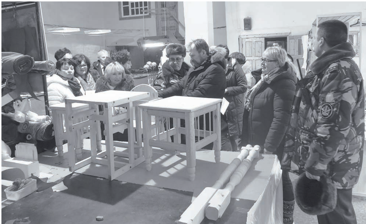
Главы осмотрели образцы столярных изделий и мебели

Главы сельских администраций смогли побывать в производственных цехах. Им предложили попробовать выпечку и различные блюда из произведённых в колонии продуктов. Для гостей был продемонстрирован фильм-отчёт за 2018 год, в котором подробно рассказано о том, как живут, чем занимаются отбывающие срок осуждённые, как работают и отдыхают сотрудники учреждения. Оценили главы и условия проживания в помещени-