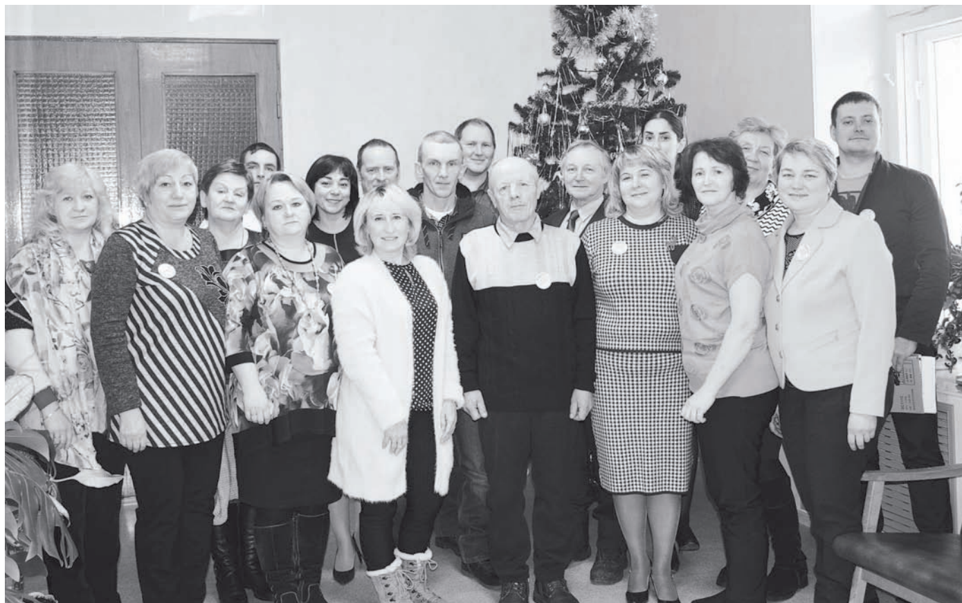
Участники конференции ТОС

С такой просьбой обратились к родителям сотрудники полиции. Они просят разъяснить детям, что при скатывании с гор можно получить серьёзные травмы, так как надувные санки-ватрушки имеют очень большую скорость и полное отсутствие управляемости. Ещё одну опасность таят неизвестные склоны – ямы, бугры, кочки, деревья или камни. Выбирать нужно проверенные спуски, лучше всего специально оборудованные.