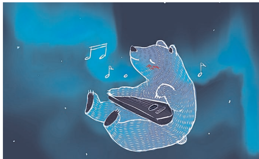
Рисунок Евы Космыниной

Кстати, мы с вами и сейчас сиянием полюбоваться можем, правда, музыки-то нам, конечно, не услышать – медведь на ухо наступил. Но знайте, что это именно ухостровские гусли играют.