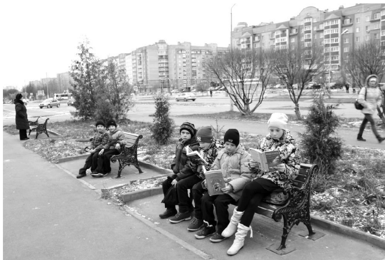
В благоустройство территории у кафе "Чикен Хауз" внесла свой вклад "Верхневолжская электромонтажная компания".

Верхневолжская электромонтажная компания... Небольшое, по меркам Удомли, предприятие, образованное всего три года назад и специализирующееся на монтаже электротехнического оборудования, в первую очередь трансформаторных подстанций. Производственная база расположена в старой части города, офис - на проспекте Курчатова, 6.