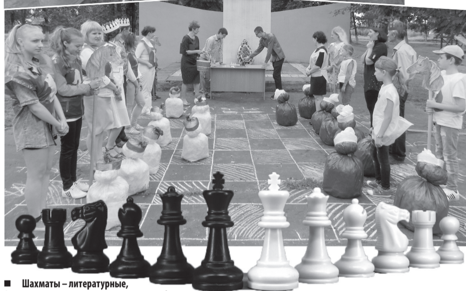
Шахматы – литературные, фигуры – живые, поэтому и правила особенные

Многие, особенно вездесущие мальчишки, подходили к мотоциклистам, чтобы полюбоваться на мотоциклы и крутые байки.