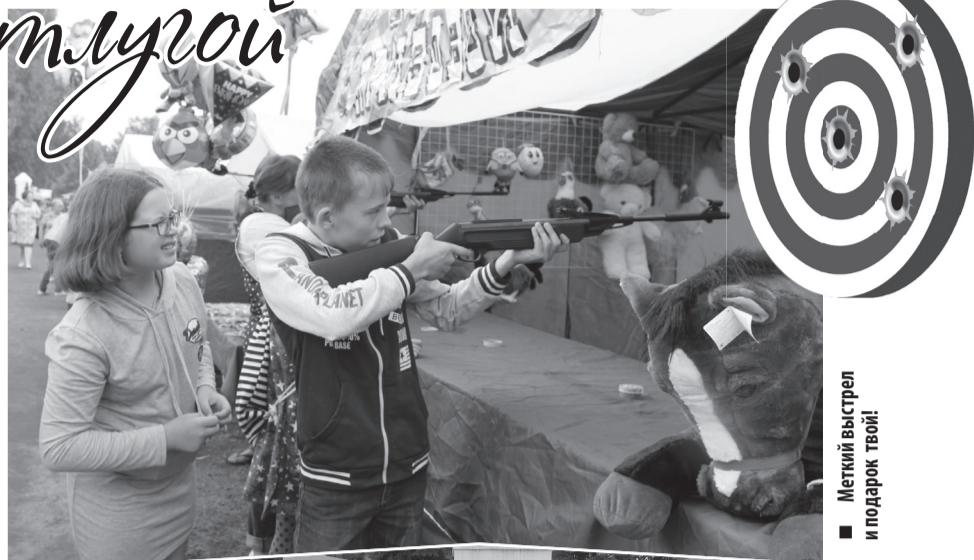
Меткий выстрел и подарок твой!