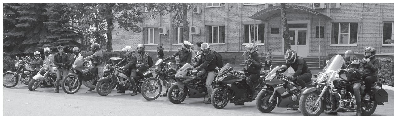
В числе гостей праздника были байкеры из «Мотосевер-НН»