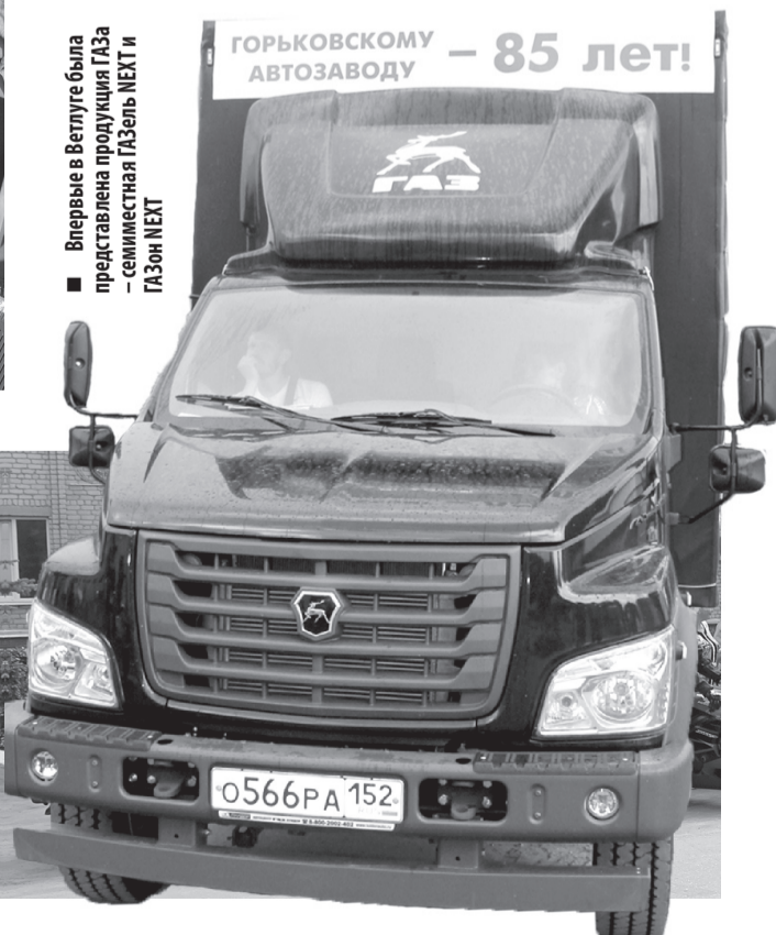
Впервые в Ветлуге была представлена продукция ГАЗа – семиместная ГАЗель NEXT и ГАЗон NEXT