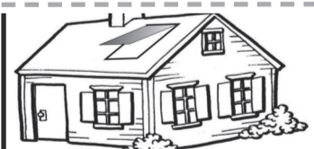
Водосливы, сайдинг, снегозадержки мансардные окна, ондулин